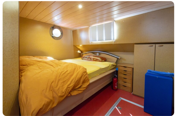
15m Stahlmotoryacht BERDA 5