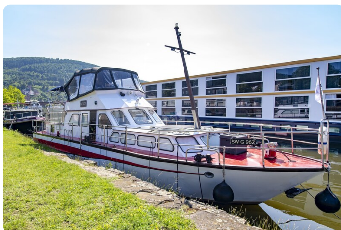
15m Stahlmotoryacht BERDA 24