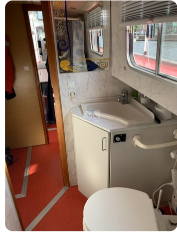
15m Stahlmotoryacht BERDA 36