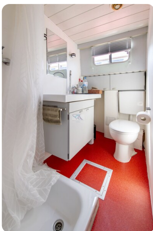
15m Stahlmotoryacht BERDA 11