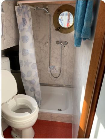
15m Stahlmotoryacht BERDA 35