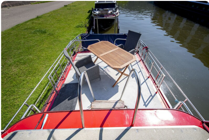
15m Stahlmotoryacht BERDA 19