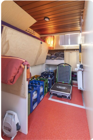
15m Stahlmotoryacht BERDA 10