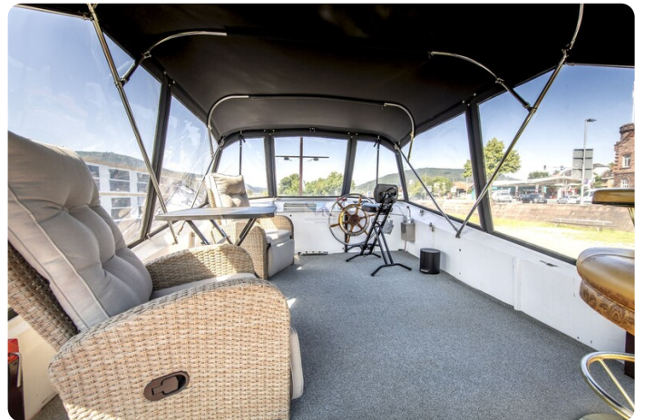
15m Stahlmotoryacht BERDA 16