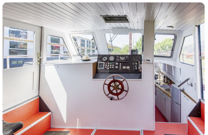
15m Stahlmotoryacht BERDA 2