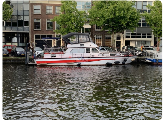
15m Stahlmotoryacht BERDA 30