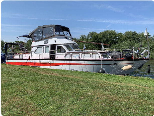
15m Stahlmotoryacht BERDA 29