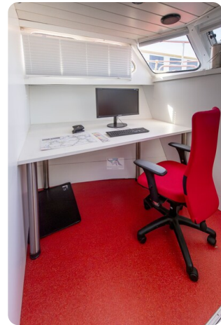
15m Stahlmotoryacht BERDA 13