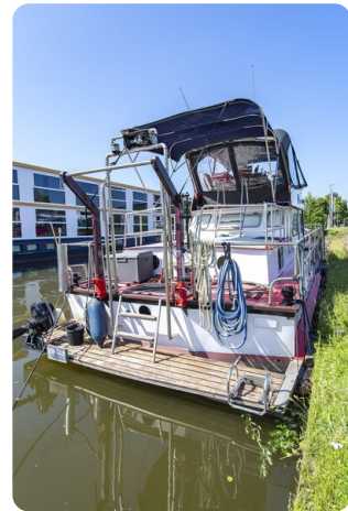
15m Stahlmotoryacht BERDA 20