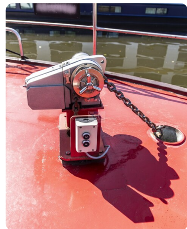
15m Stahlmotoryacht BERDA 26