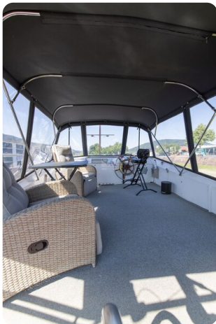
15m Stahlmotoryacht BERDA 17