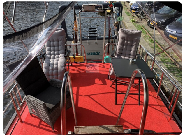
15m Stahlmotoryacht BERDA 31