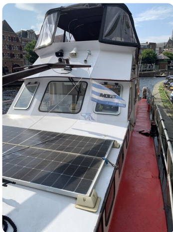
15m Stahlmotoryacht BERDA 32