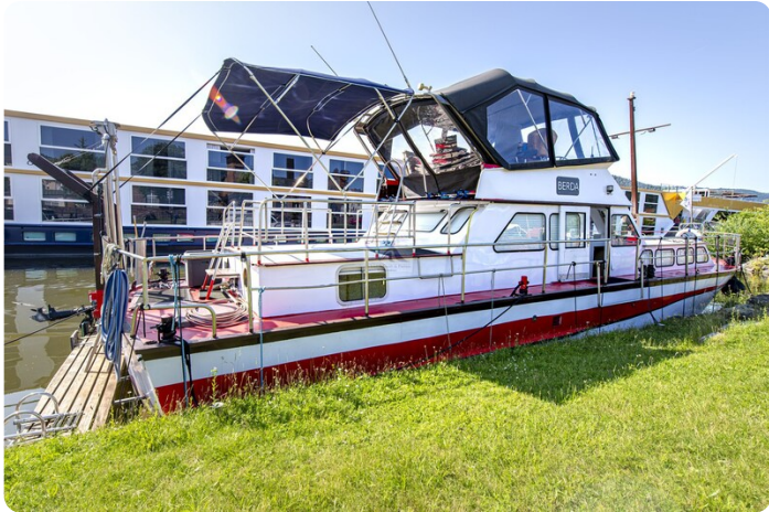
15m Stahlmotoryacht BERDA 22