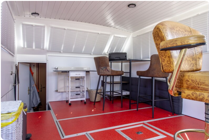
15m Stahlmotoryacht BERDA 15