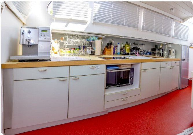
15m Stahlmotoryacht BERDA 38