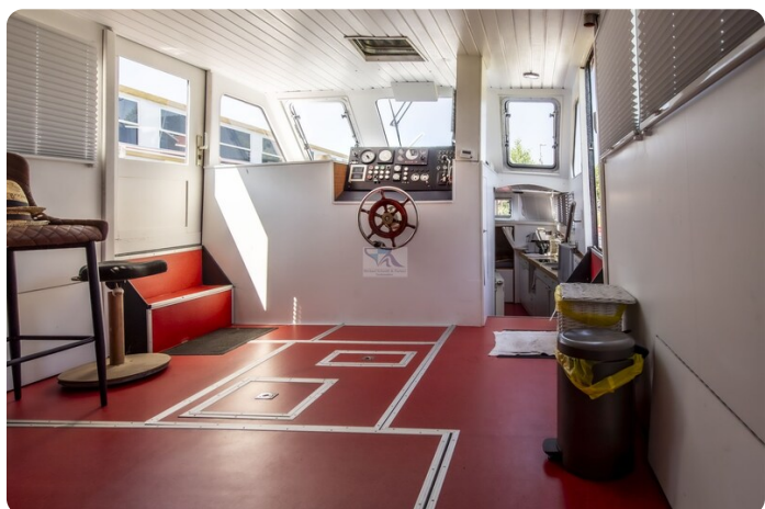
15m Stahlmotoryacht BERDA 4