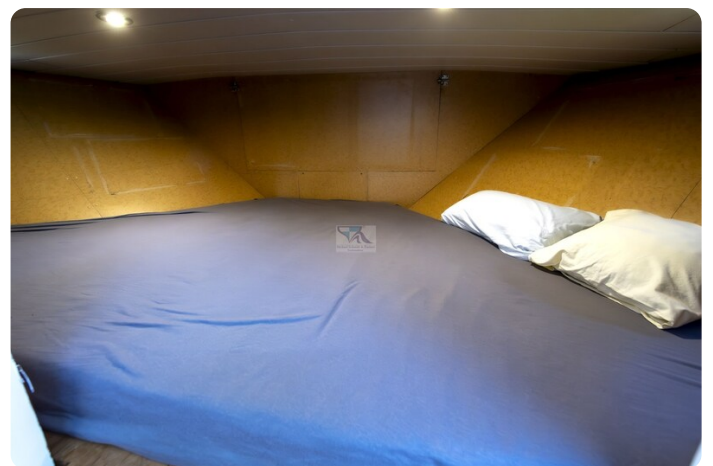
15m Stahlmotoryacht BERDA 12