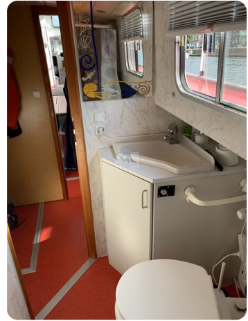
15m Stahlmotoryacht BERDA 36