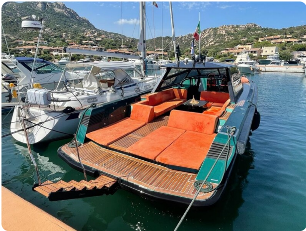
Docked with transformer ladder