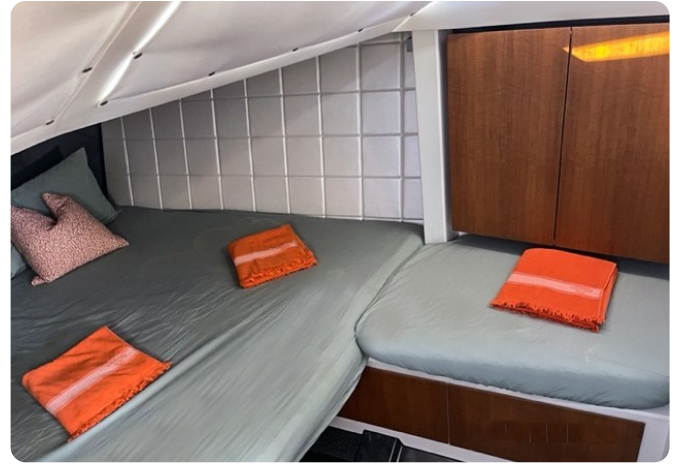
{I} Guest cabin