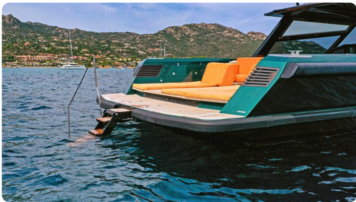
Hydraulic bathing ladder