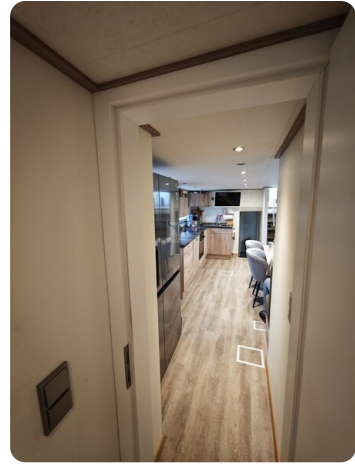
MY GINO 40