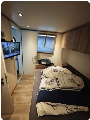
MY GINO 37