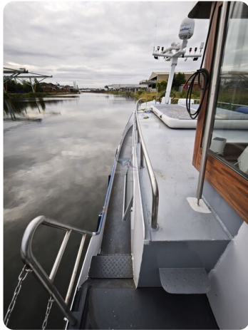
MY GINO 7