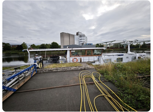
MY GINO 4