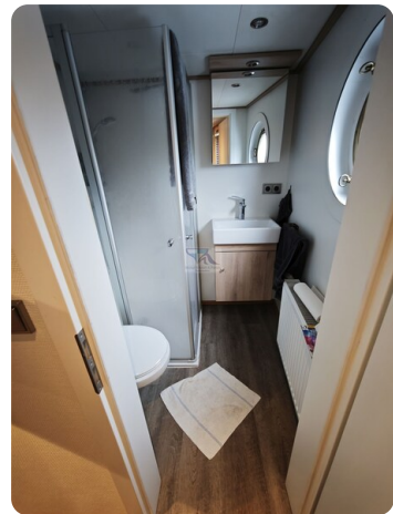
MY GINO 38