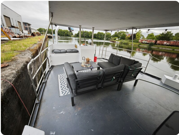
MY GINO 19