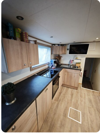
MY GINO 28