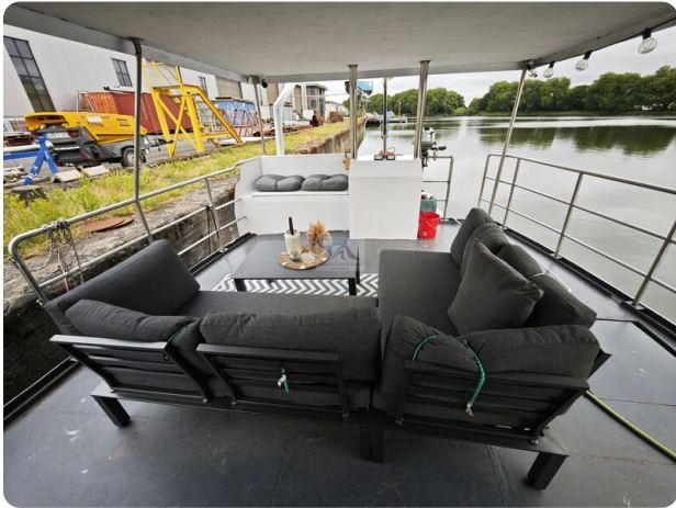
MY GINO 20