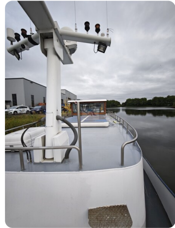
MY GINO 14