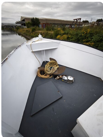
MY GINO 13