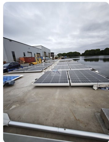
MY GINO 11