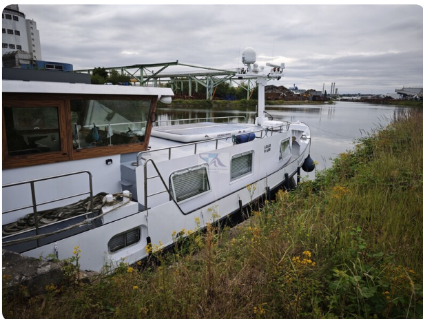
MY GINO 2