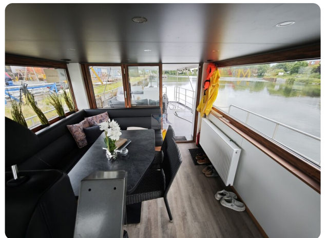
MY GINO 26