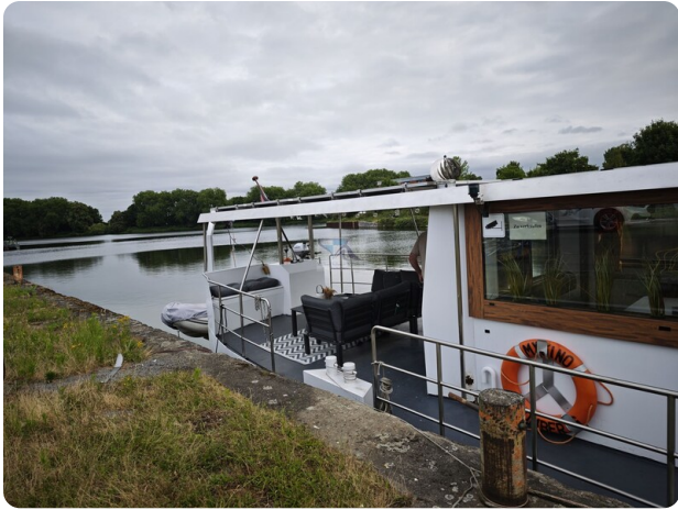
MY GINO 3