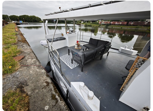
MY GINO 5