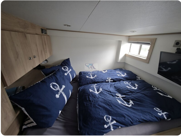
MY GINO 33