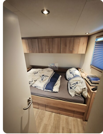
MY GINO 36