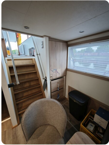
MY GINO 30