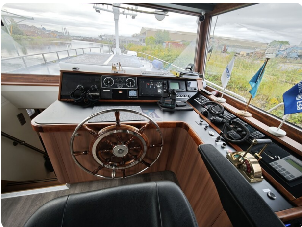
MY GINO 23