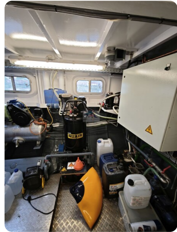
MY GINO 51