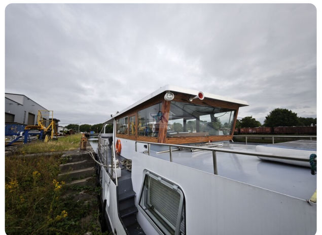
MY GINO 18