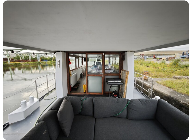
MY GINO 22