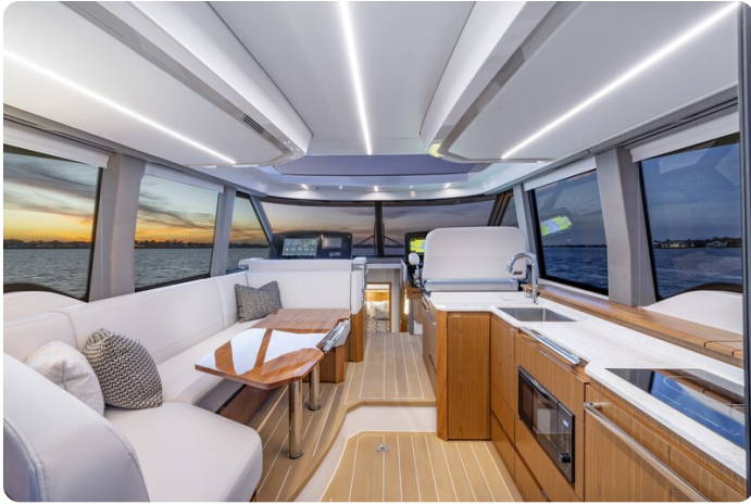
Tiara EX54 salon