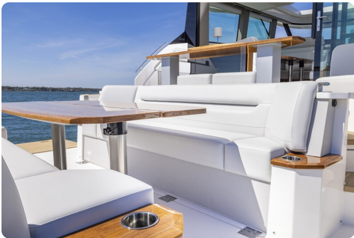
Tiara EX54 Aft Cockpit Lounge