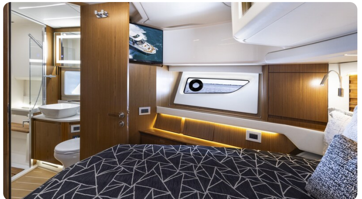
Tiara EX54 VIP cabin detail