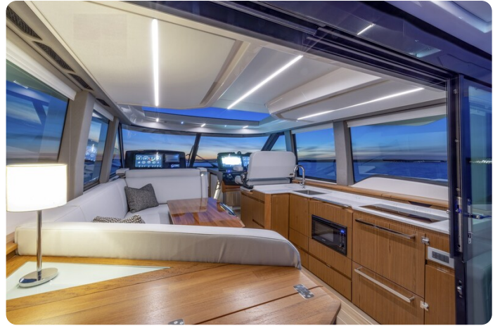
Tiara EX54 galley