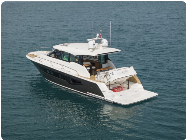
Tiara EX54 aft view