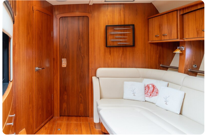
{1} Lower convertible dinette