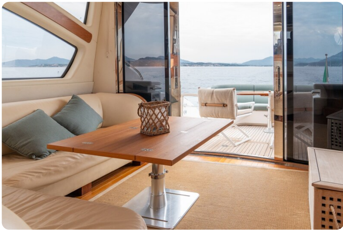
{1} Salon view