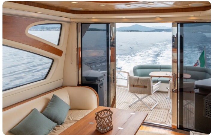
{1} Salon to aft