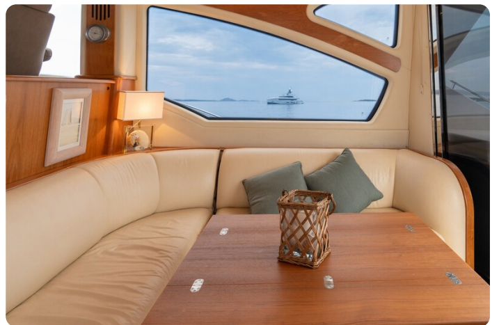
{1} Dinette detail