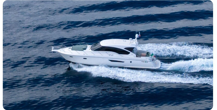
Tiara 5800 Sovran running