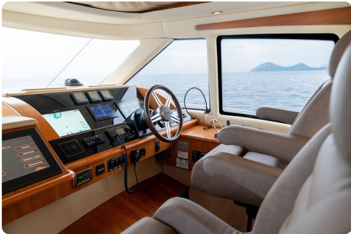
{1} Helm station