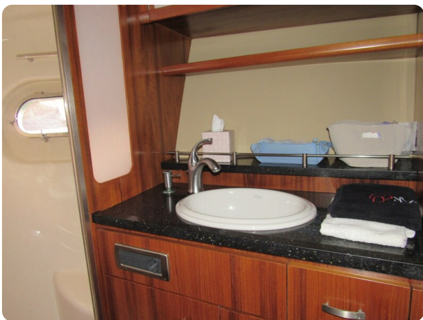
{1} Bathroom detail