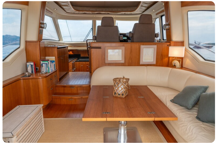
{1} Salon to bow