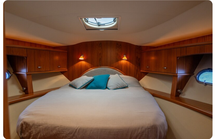
{1} Vip cabin