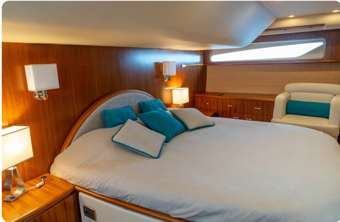
{1} Owner's cabin