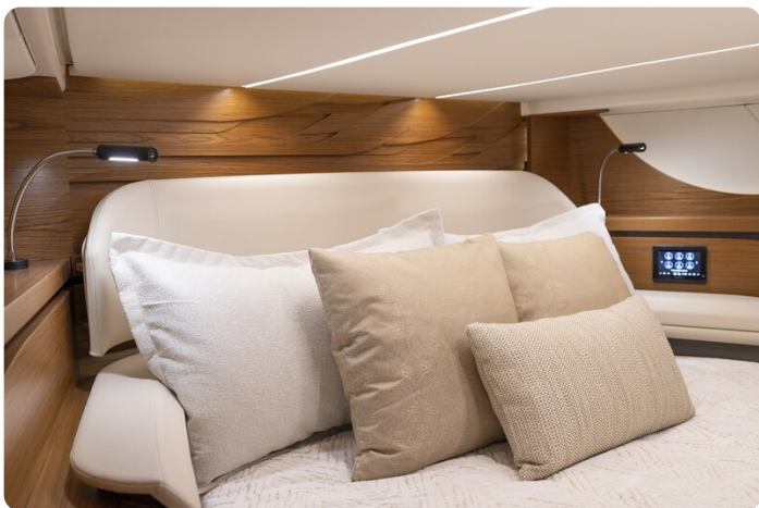
Tiara 56LS owner's cabin detail