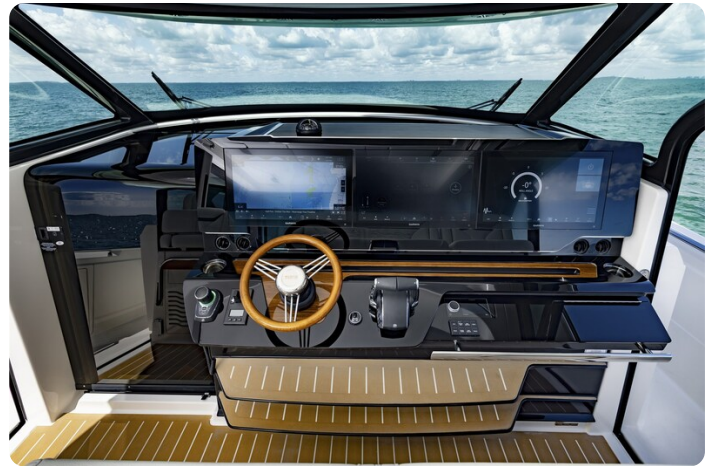
Tiara 56LS helm station