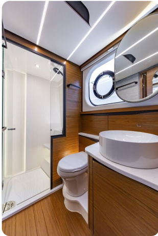
Tiara 56LS owner's bathroom