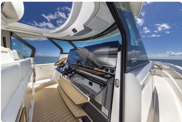
Tiara 56LS helm by side