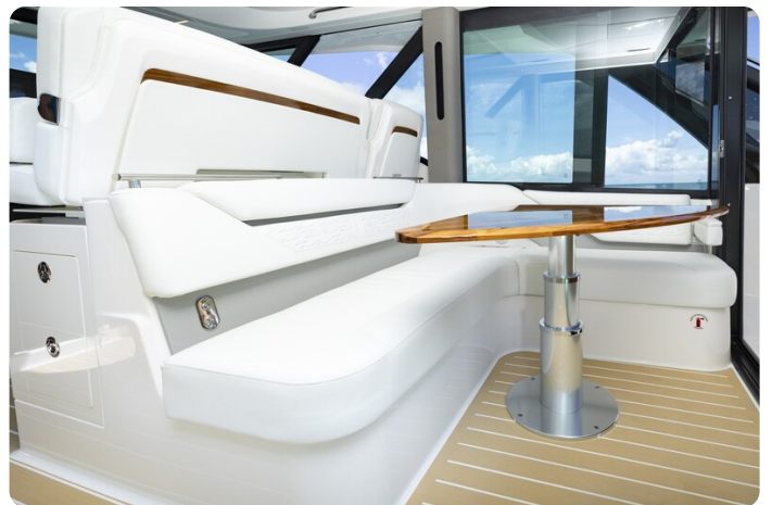
Tiara 56LS dinette detail