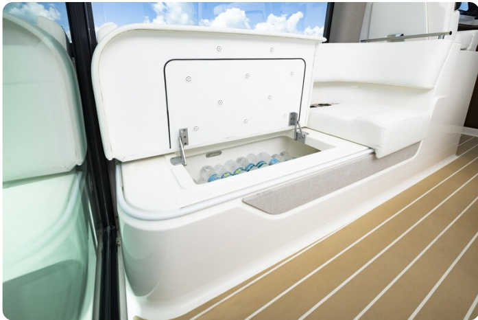
Tiara 56LS cockpit fridge