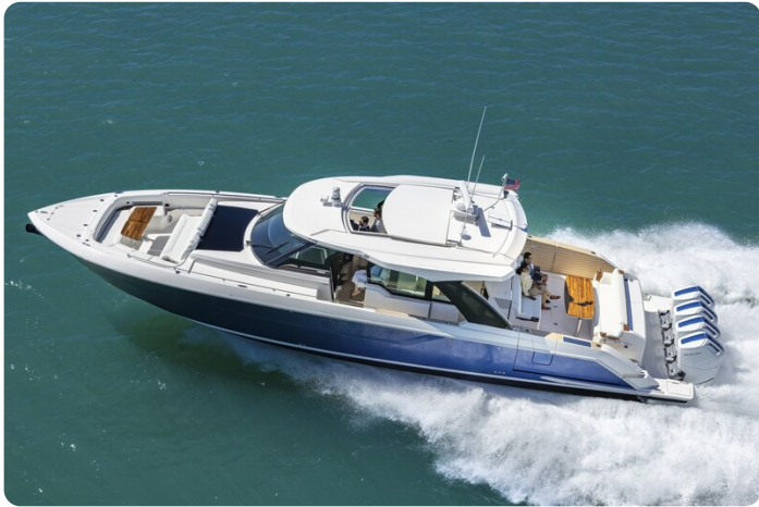
Tiara 56LS aerial