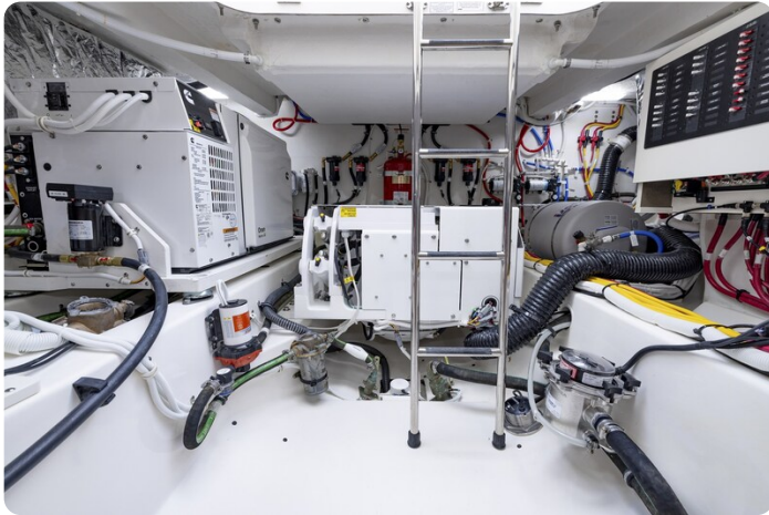
Tiara 56LS technical room