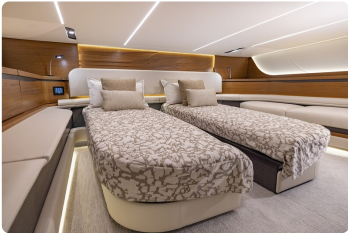
Tiara 56LS guest berth convertible in twin