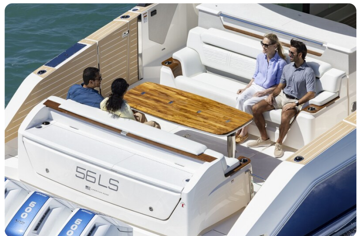
Tiara 56LS cockpit detail