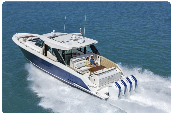
Tiara 56LS running