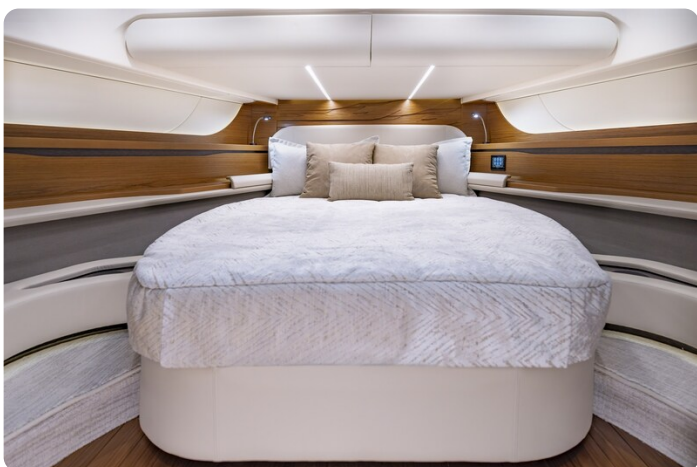
Tiara 56LS owner's cabin