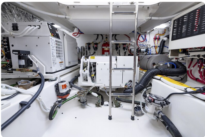
Tiara 56LS technical room