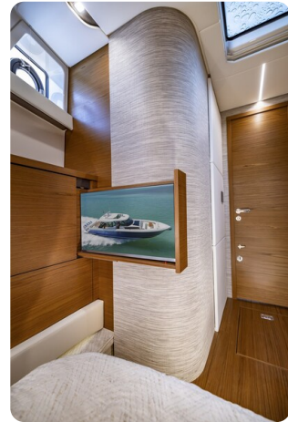
Tiara 56LS owner's cabin tv