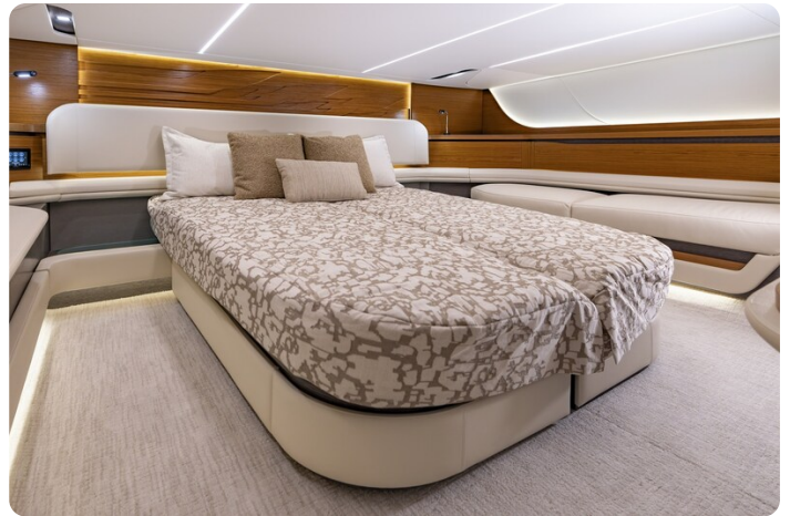
Tiara 56LS guest cabin