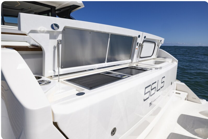
Tiara 56LS transom detail