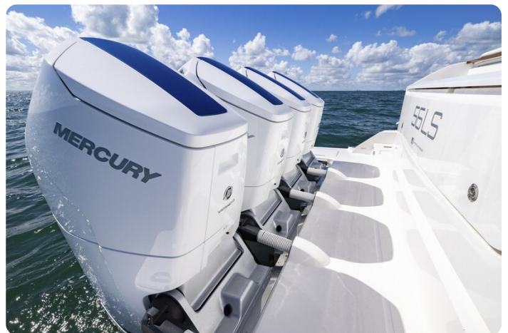
Tiara 56LS engines detail