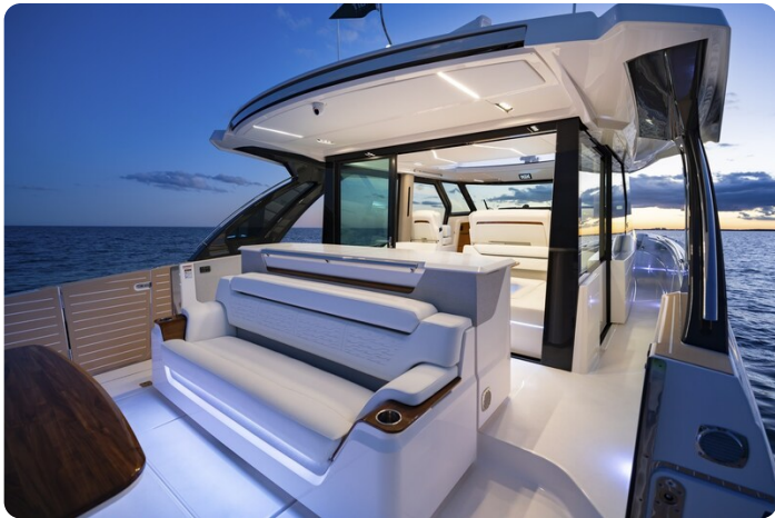
Tiara 56LS night view