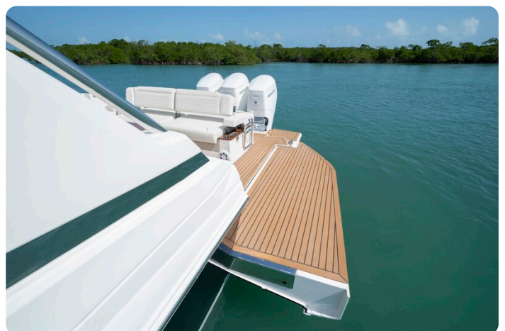
Tiara 48LS side platform