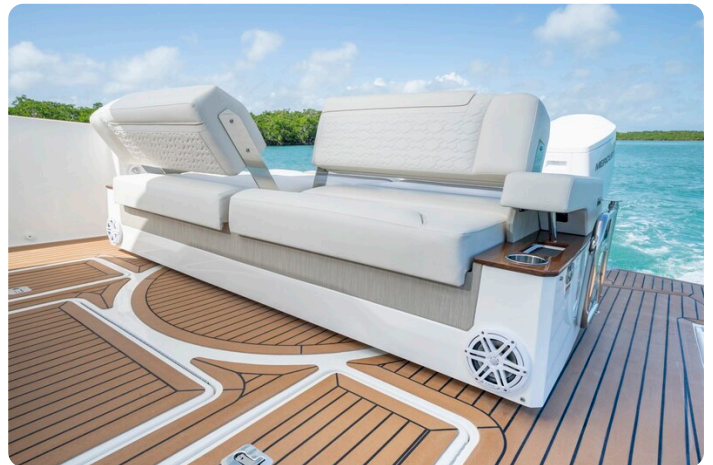
Tiara 48LS aft seats