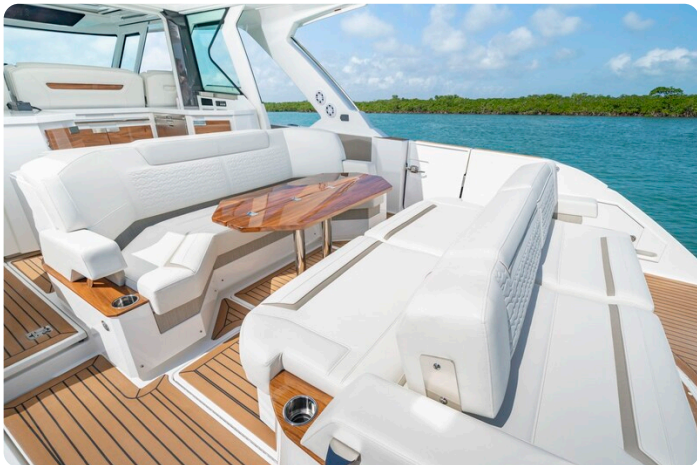
Tiara 48LS aft dinette