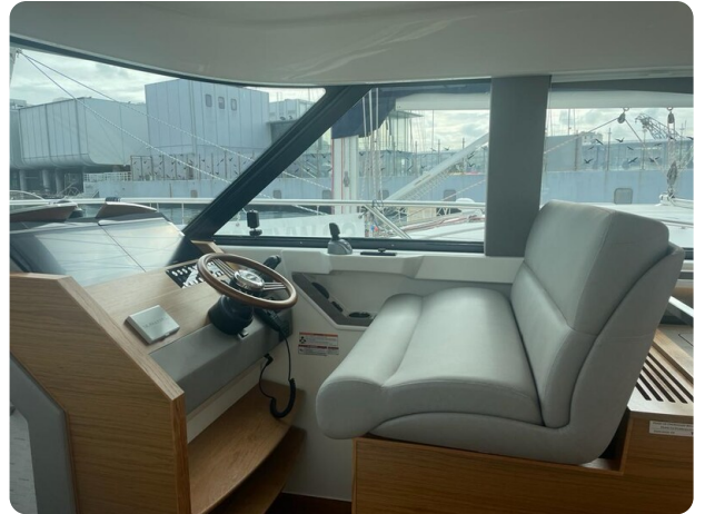
{1} Helm station