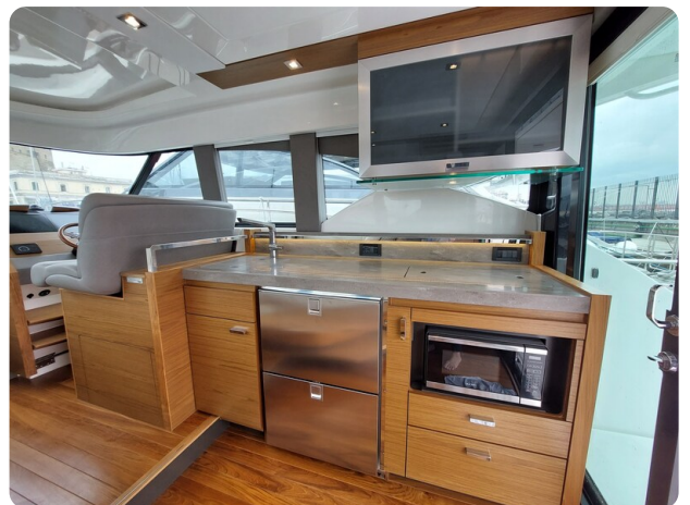
{1} Galley detail