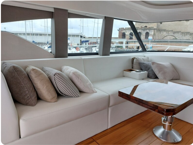
{1} Dinette details