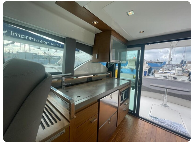
{1} Salon detail