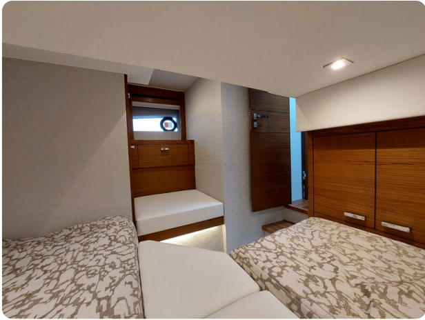
{I} Guests cabin detail