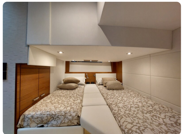
{1} Guests cabin