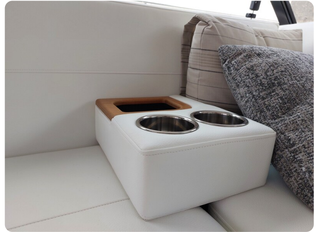
{1} Dinette detail