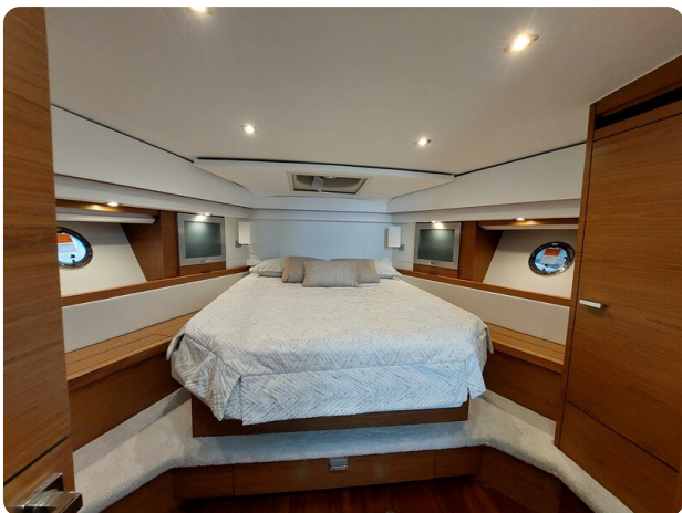
{1} Owner's cabin