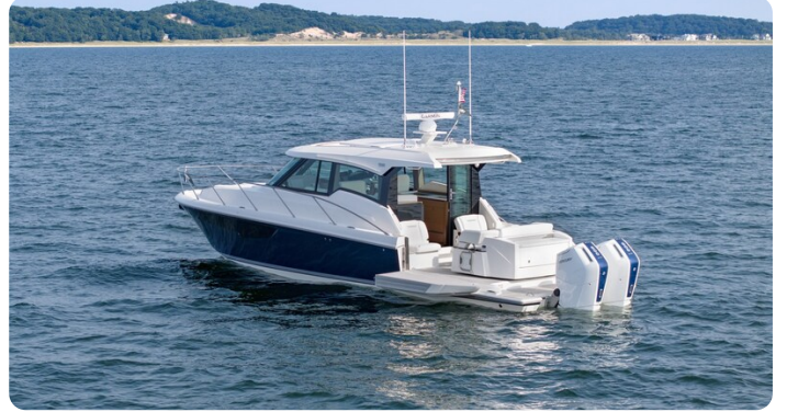
43 LE Nav