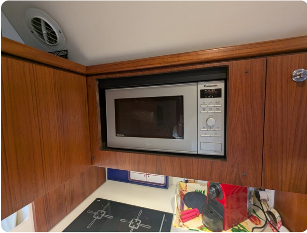
Tiara 4100 Open, galley detail