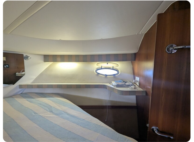
Tiara 4100 Open owner's cabin detail