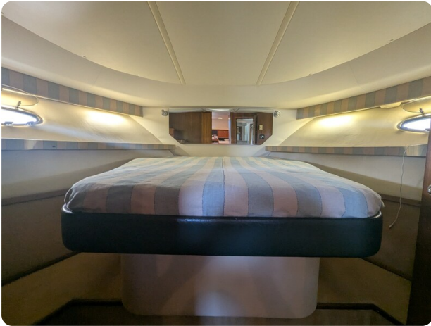
Tiara 4100 Open owner's cabin