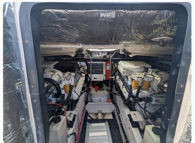
Tiara 4100 Open engine room