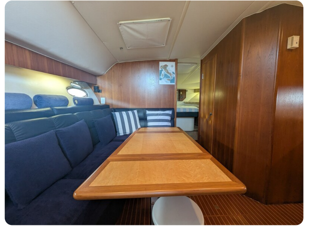
Tiara 4100 Open interiors