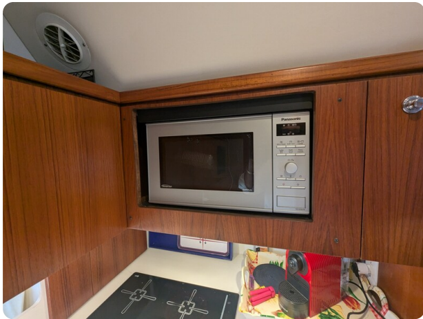
Tiara 4100 Open, galley detail