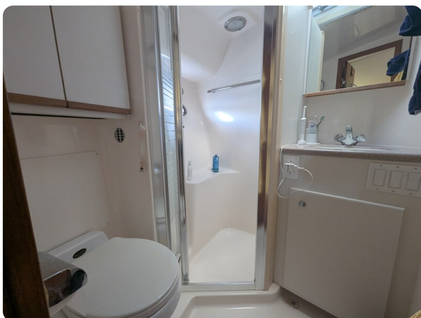
Tiara 4100 Open head view