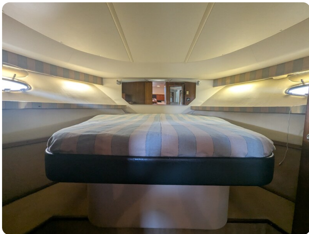
Tiara 4100 Open owner's cabin