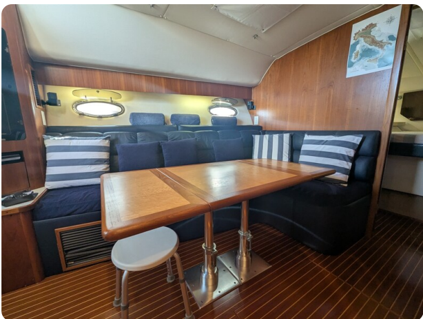
Tiara 4100 Open dinette