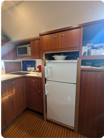
Tiara 4100 Open galley detail