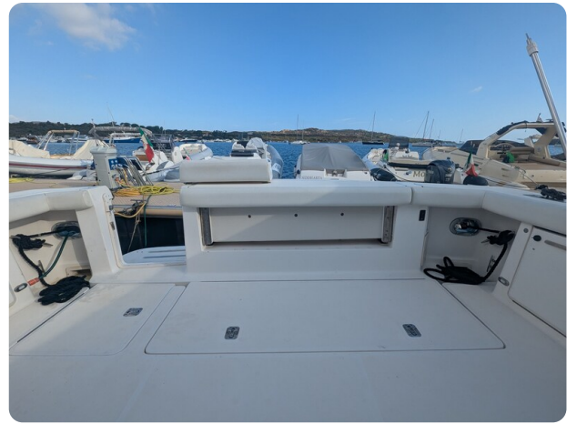
Tiara 4100 Open cockpit