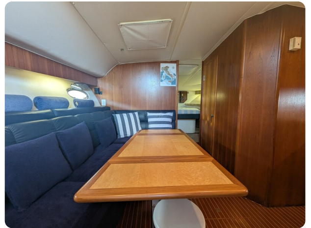
Tiara 4100 Open interiors