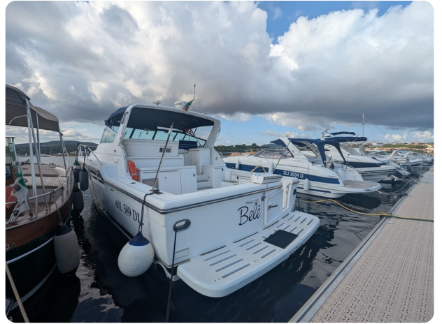
Tiara 4100 Open stern