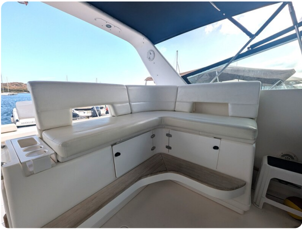
Tiara 4100 Open upper dinette