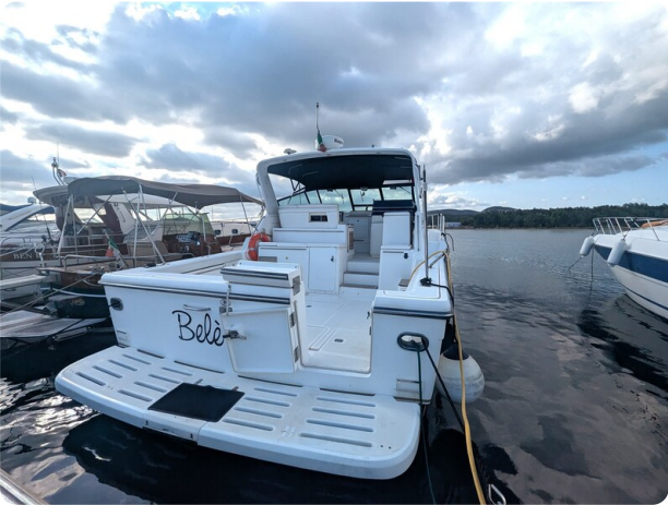
Tiara 4100 Open aft view