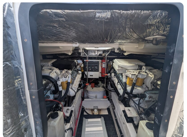
Tiara 4100 Open engine room