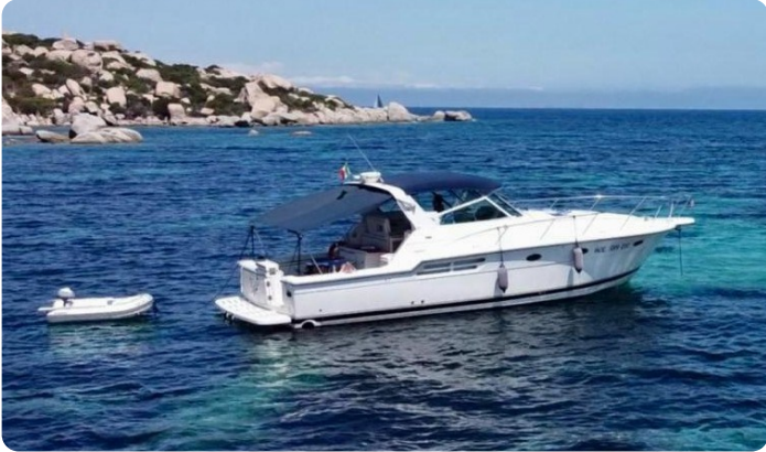
Tiara 4100 Open anchored