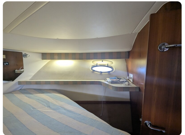
Tiara 4100 Open owner's cabin detail