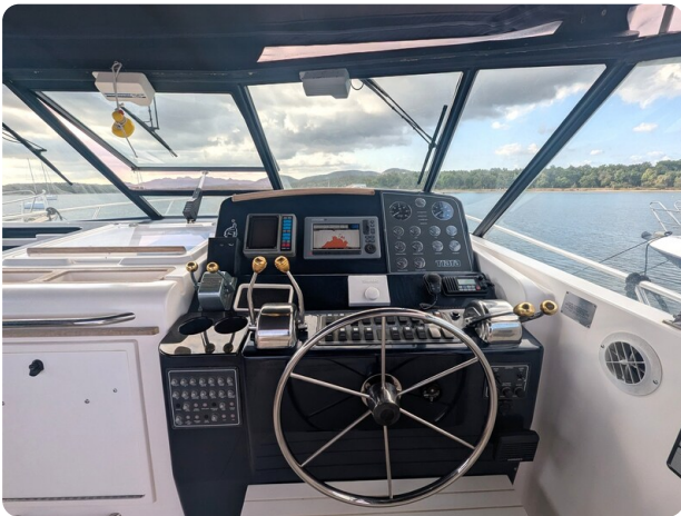
Tiara 4100 Open helm