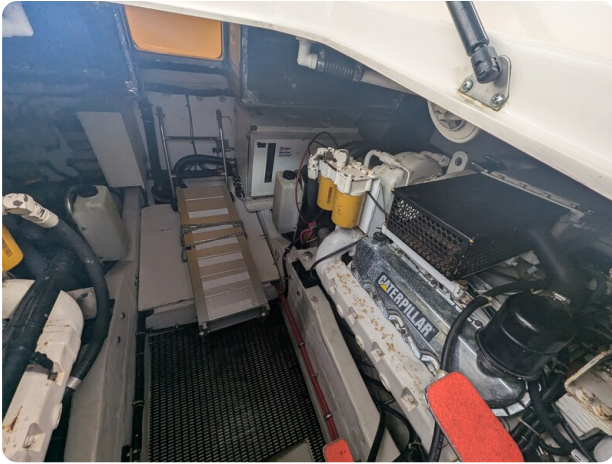
Tiara 4100 Open engine room detail