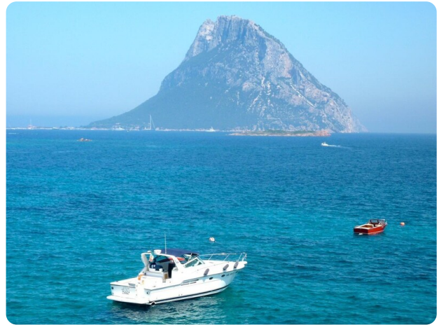
Tiara 4100 Open anchored