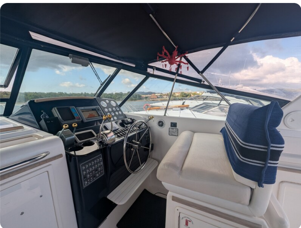
Tiara 4100 Open helm station