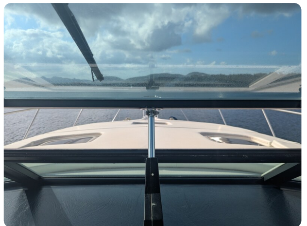
Tiara 4100 Open fwd deck