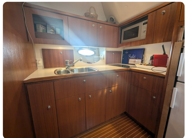
Tiara 4100 Open galley