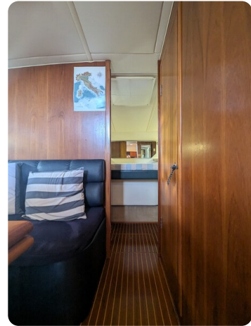
Tiara 4100 Open interior detail