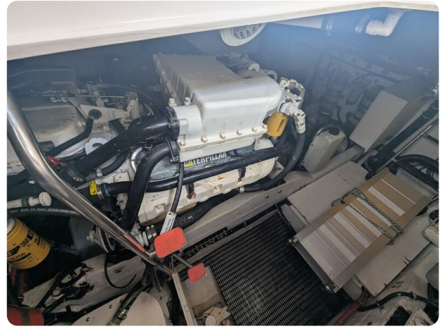
Tiara 4100 Open engine detail