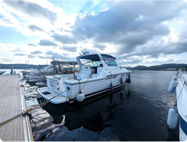
Tiara 4100 Open aft profile