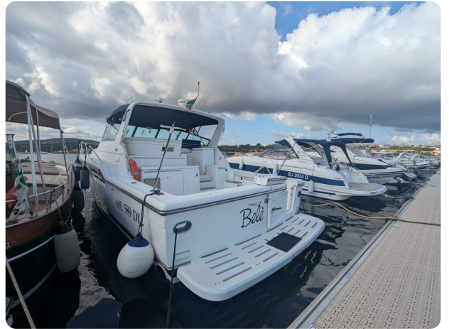
Tiara 4100 Open berthed