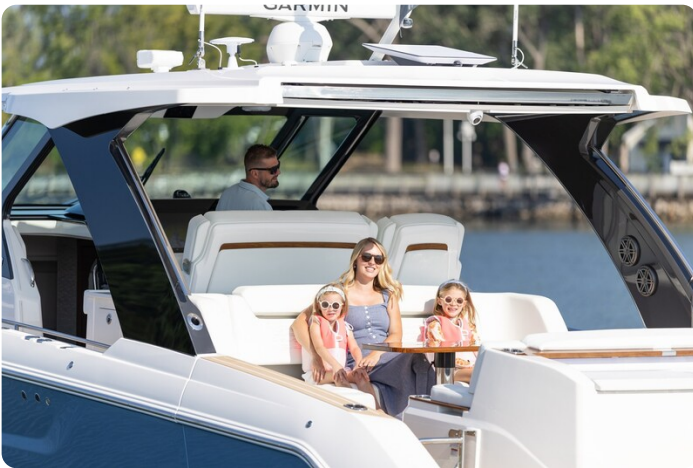
Tiara 39LS lifestyle