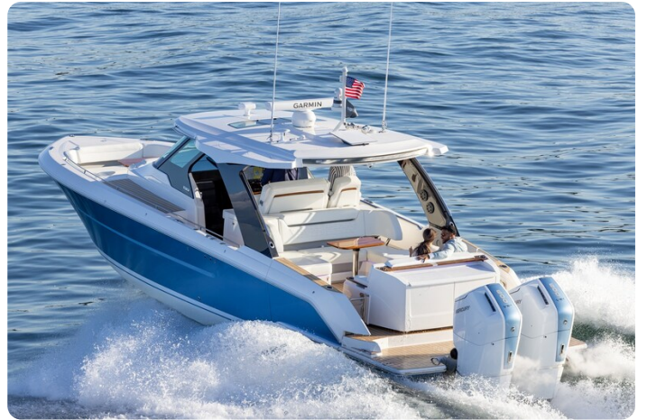
Tiara 39LS aft view