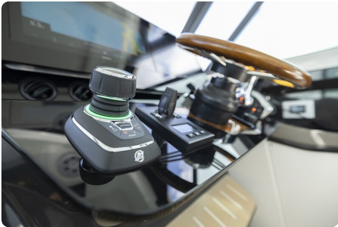
{1} Helm detail