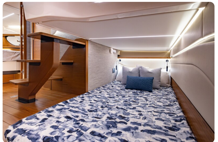
{1} Aft berth