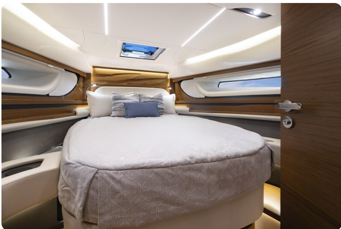
{1} Master cabin