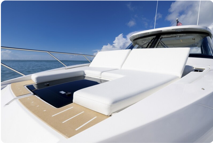
Fwd sunpad and lounge