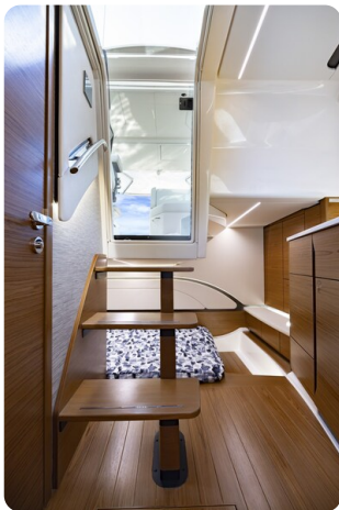
{1} Lower deck stairs