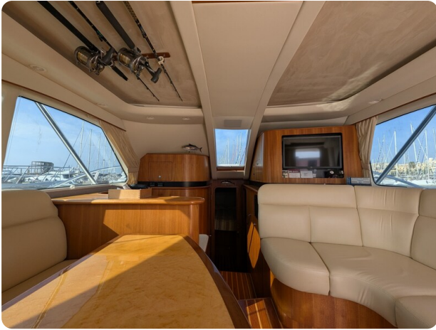
Tiara 3900 Conv. salon view