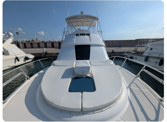
Tiara 3900 Conv. bow deck