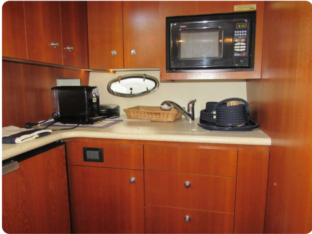
Tiara 3800 Open galley