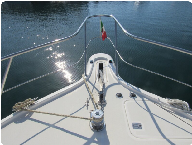
Tiara 3800 Open, bow pulpit