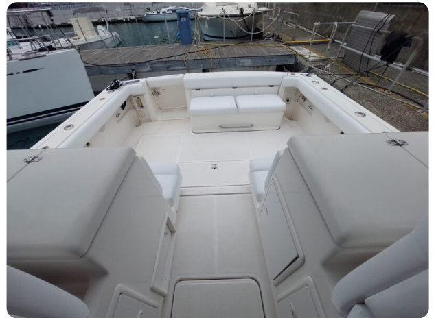
Tiara 3500 Open Sampei cockpit view