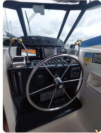
Tiara 3500 Open Sampei helm station