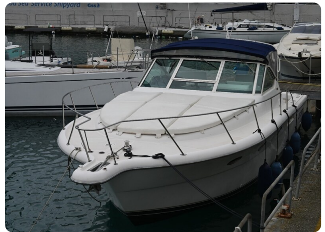
Tiara 3500 Open Sampei bow view