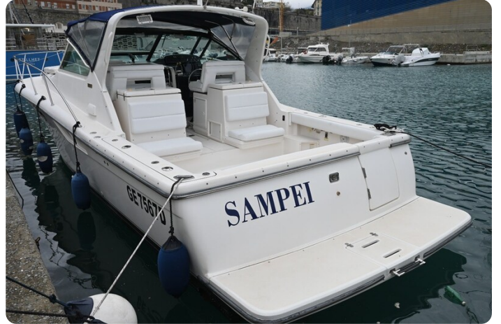
Tiara 3500 Open Sampei aft profile 2