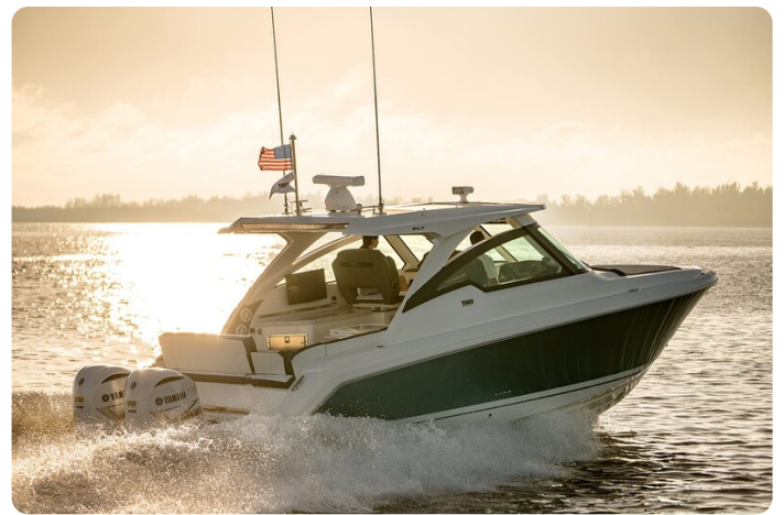
Tiara 34 LX running 2