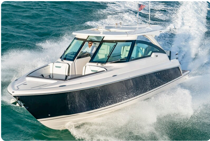
Tiara 34 LX Sport running