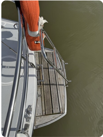
Targa 9.60m FOXY LADY 38