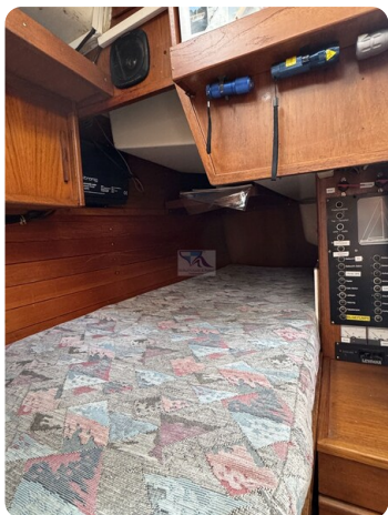
Targa 9.60m FOXY LADY 15