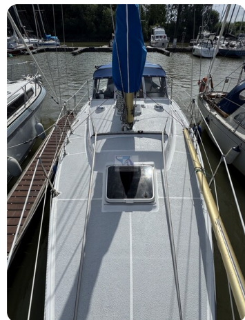
Targa 9.60m FOXY LADY 32