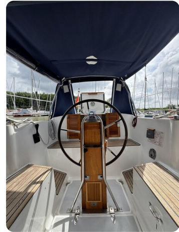
Targa 9.60m FOXY LADY 55