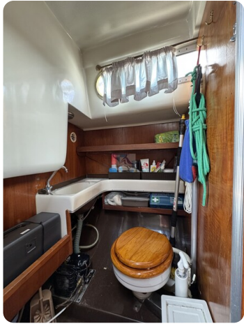
Targa 9.60m FOXY LADY 12