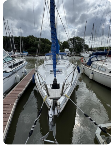
Targa 9.60m FOXY LADY 60