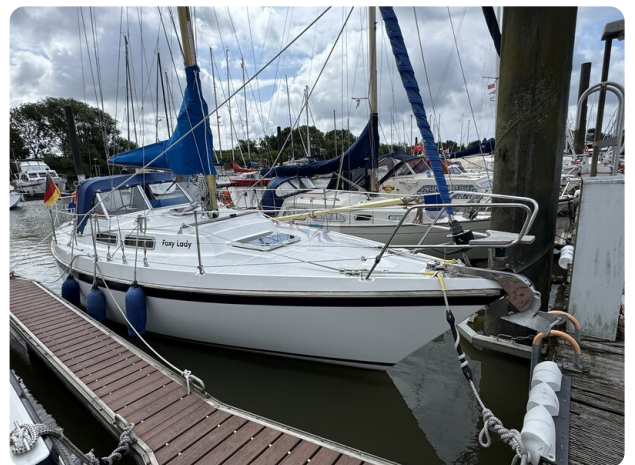
Targa 9.60m FOXY LADY 57