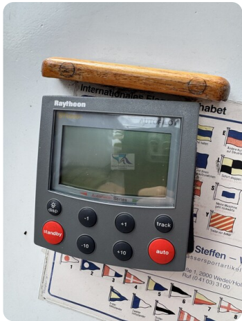
Targa 9.60m FOXY LADY 56