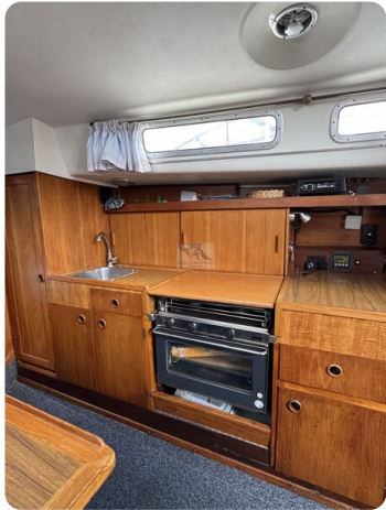
Targa 9.60m FOXY LADY 2