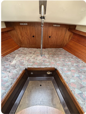
Targa 9.60m FOXY LADY 41