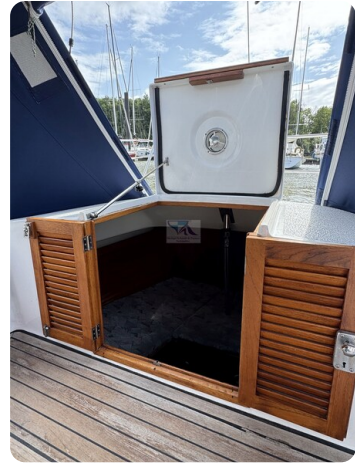
Targa 9.60m FOXY LADY 40