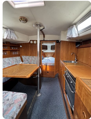
Targa 9.60m FOXY LADY 10