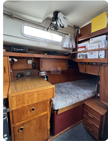
Targa 9.60m FOXY LADY 3