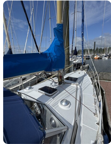
Targa 9.60m FOXY LADY 27