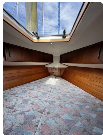
Targa 9.60m FOXY LADY 4