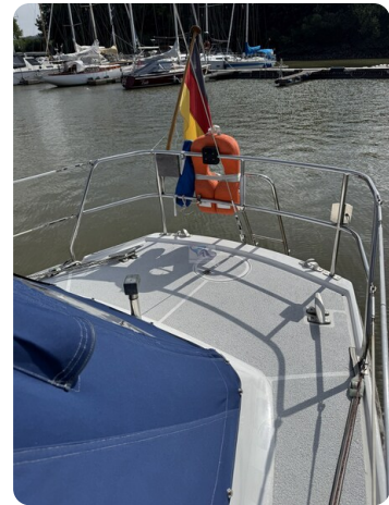
Targa 9.60m FOXY LADY 36