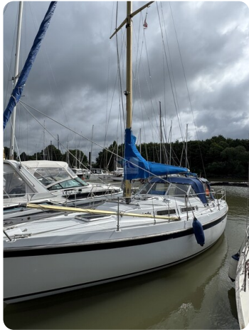
Targa 9.60m FOXY LADY 1