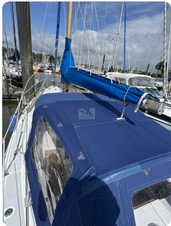
Targa 9.60m FOXY LADY 37