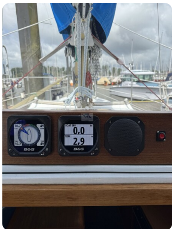
Targa 9.60m FOXY LADY 44