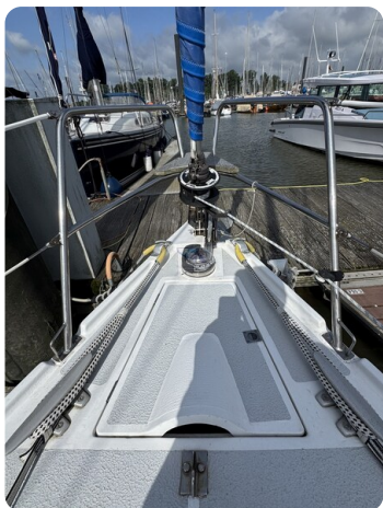
Targa 9.60m FOXY LADY 30