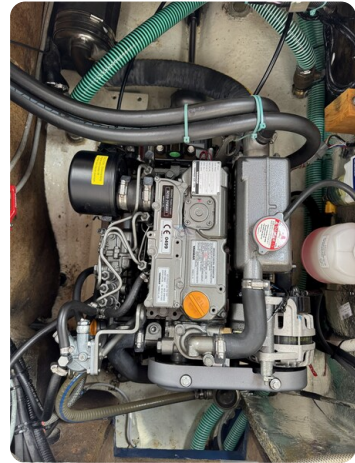
Targa 9.60m FOXY LADY 48