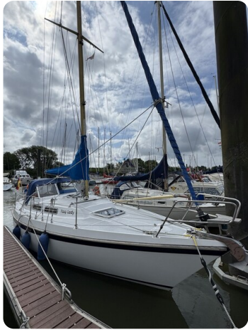
Targa 9.60m FOXY LADY 59