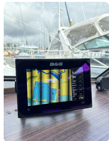
Targa 9.60m FOXY LADY 45