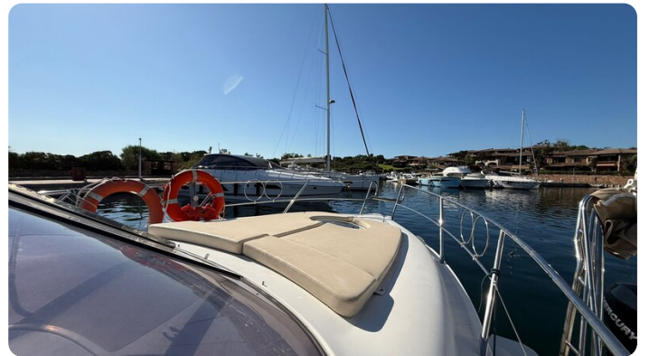
Fwd deck side