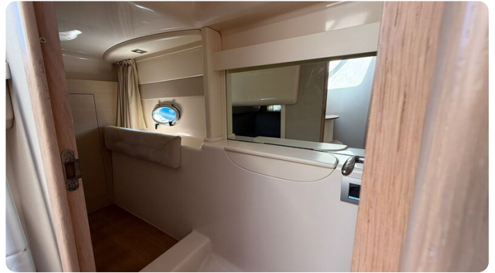
{1}Aft Cabin Access