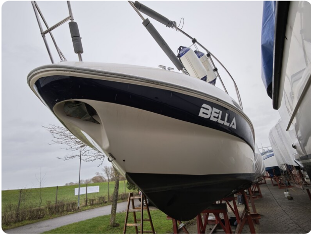
Sealine 28 BELLA 63