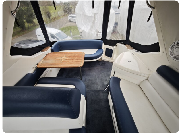
Sealine 28 BELLA 40