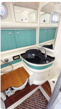
Sealine 28 Sport 49