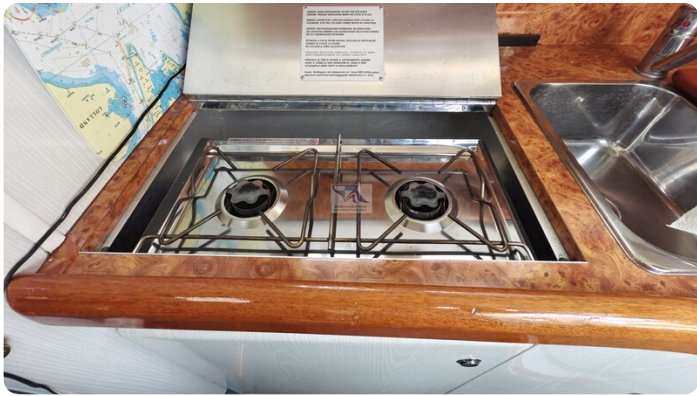
Sealine 28 Sport 32