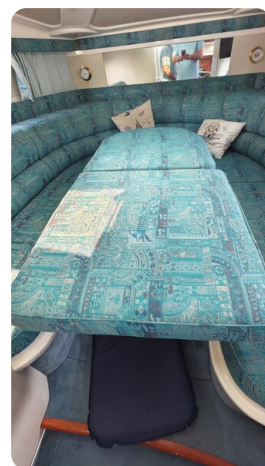
Sealine 28 Sport 51