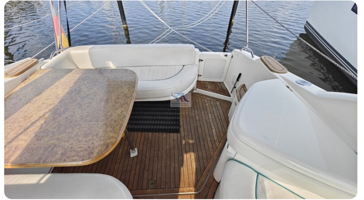
Sealine 28 Sport 19