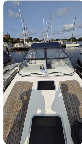
Sealine 28 Sport 15