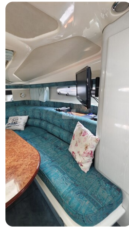
Sealine 28 Sport 44