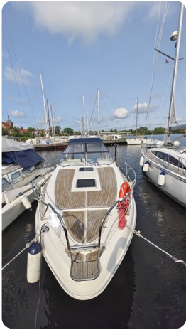
Sealine 28 Sport 8a