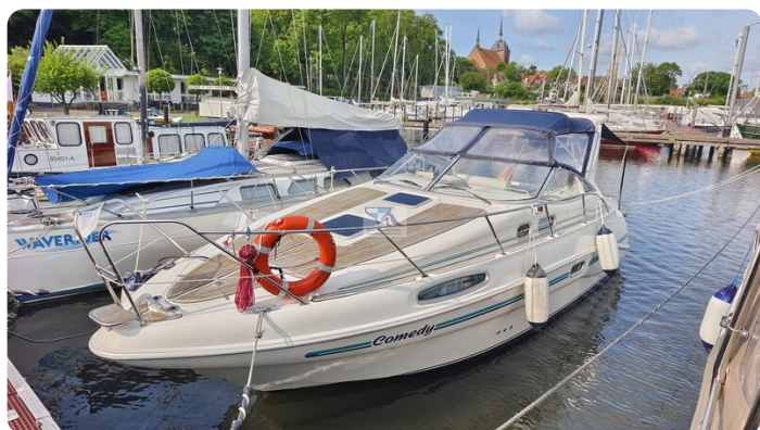
Sealine 28 Sport 6