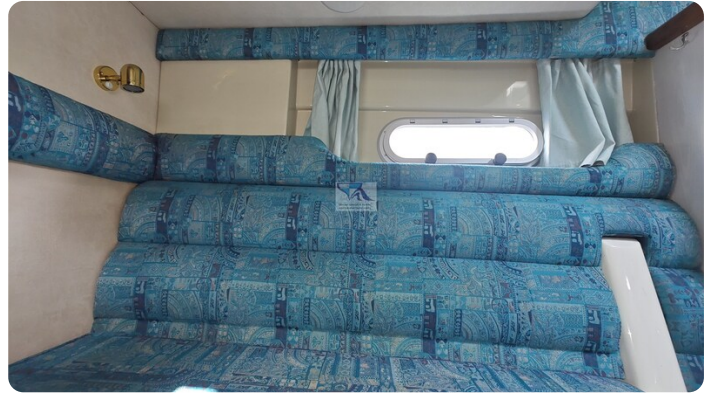
Sealine 28 Sport 61