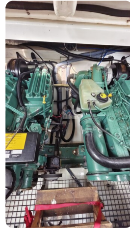
Sealine 28 Sport 67