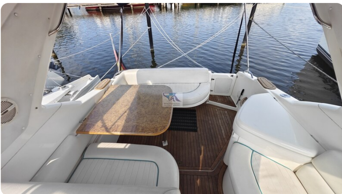
Sealine 28 Sport 16