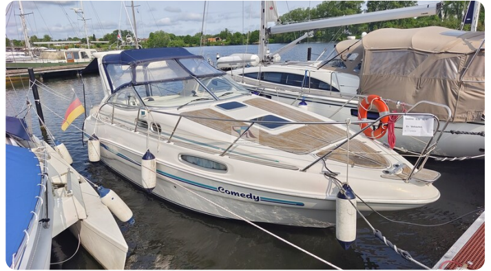
Sealine 28 Sport 10