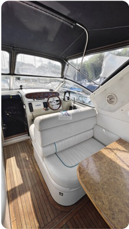
Sealine 28 Sport 20