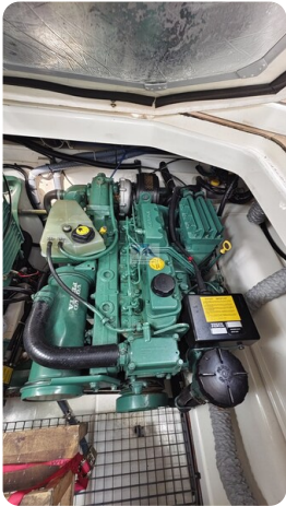
Sealine 28 Sport 65