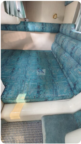
Sealine 28 Sport 52