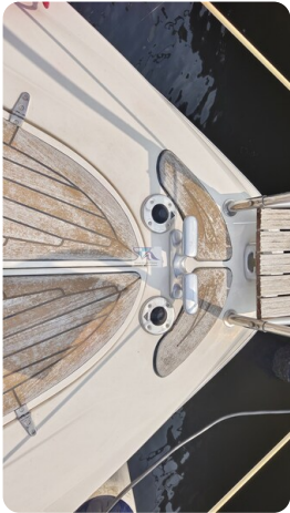
Sealine 28 Sport 14