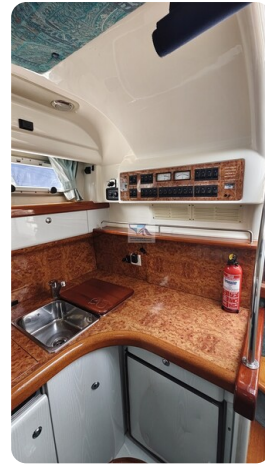
Sealine 28 Sport 35