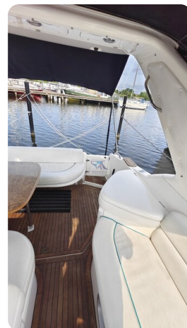
Sealine 28 Sport 17