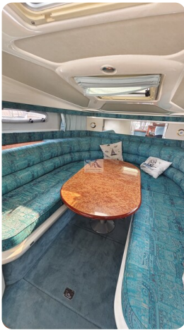
Sealine 28 Sport 41