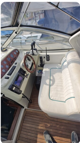
Sealine 28 Sport 27