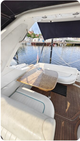
Sealine 28 Sport 18