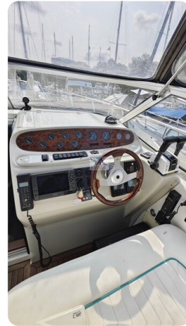
Sealine 28 Sport 22