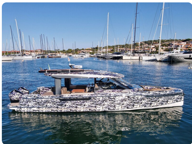
Saxdor 400 profile