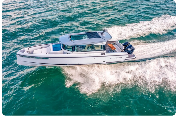
Saxdor 320 GTC aerial 2