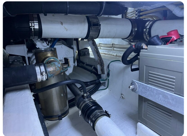
{I} Engine room