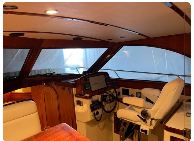
{1} Lower helm station