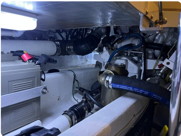
{I} Engine room