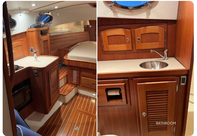
{I} Lower deck