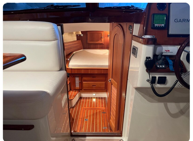
{1} Lower deck access