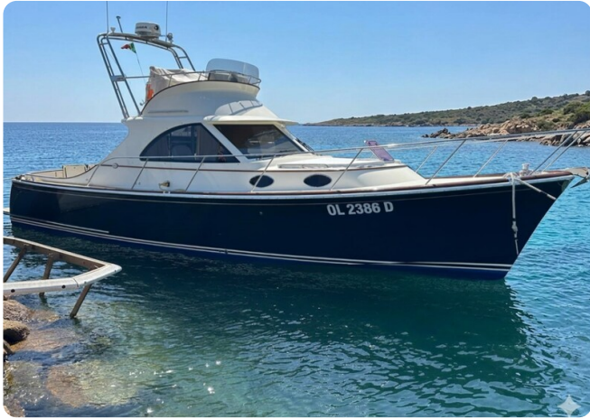
San Juan 40 FB Texas