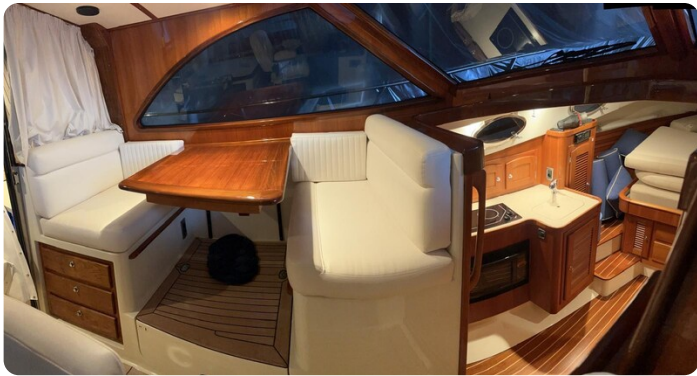
{1} Dinette and galley