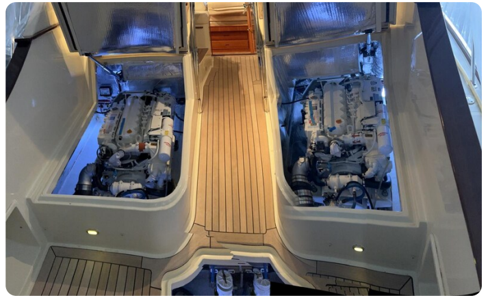
{1} Engine room