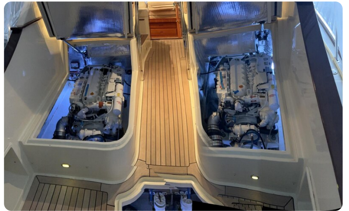
{1} Engine room