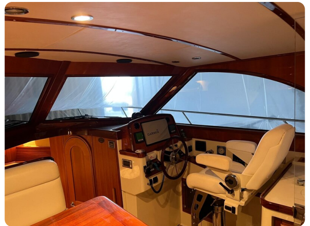
{1} Lower helm station