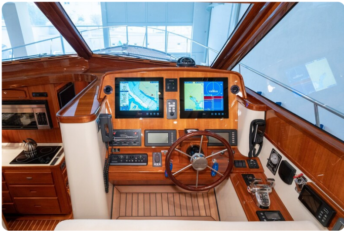
San Juan 48 Helm detail