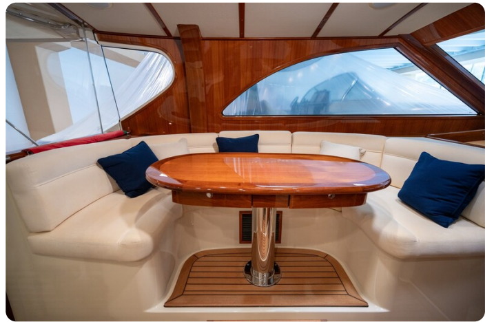
San Juan 48 dinette