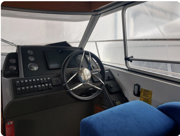
Saga 390 HT .jpg