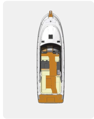
Saga 390 HT layout.jpg