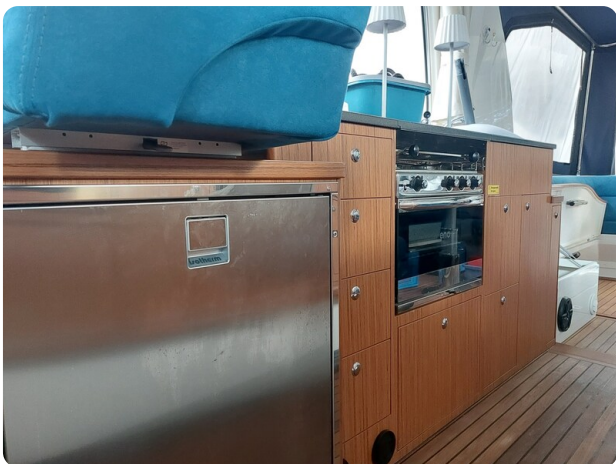
Saga 390 HT.jpg