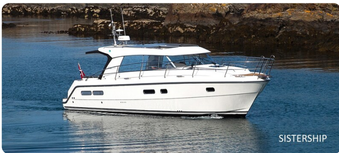
Saga 39 HT sistership