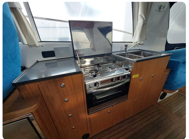
Saga 390 HT.jpg