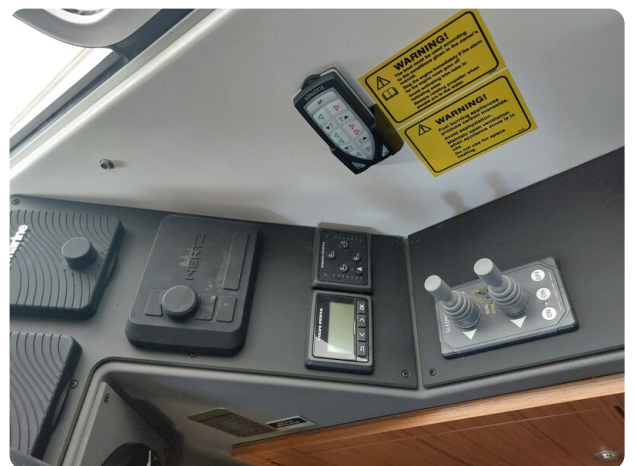
Saga 390 HT.jpg