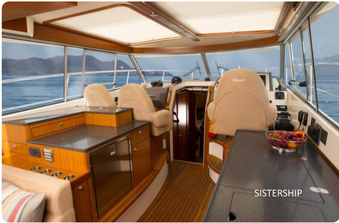
Saga 390 HT Sistership.jpg