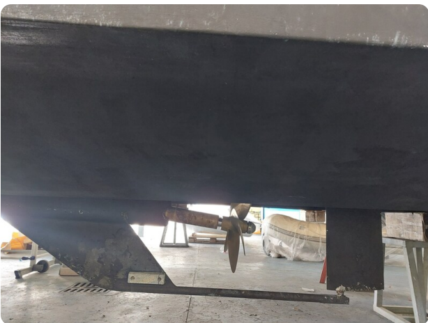
Saga 390 HT.jpg