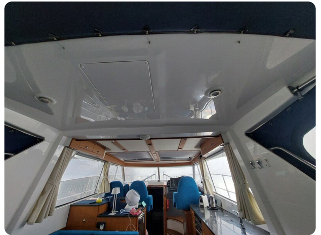
Saga 390 HT.jpg