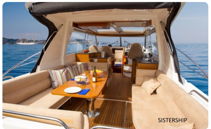
Saga 390 HT Sistership 2.jpg