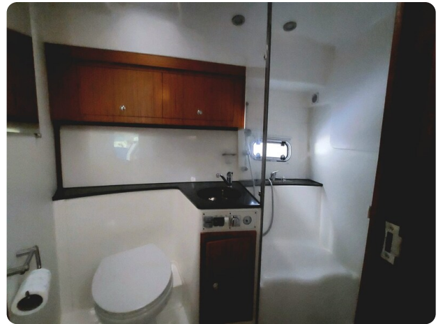
Saga 390 HT toilette