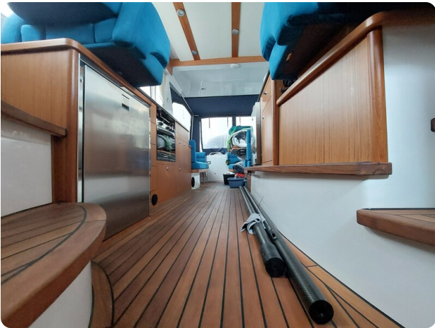
Saga 390 HT.jpg