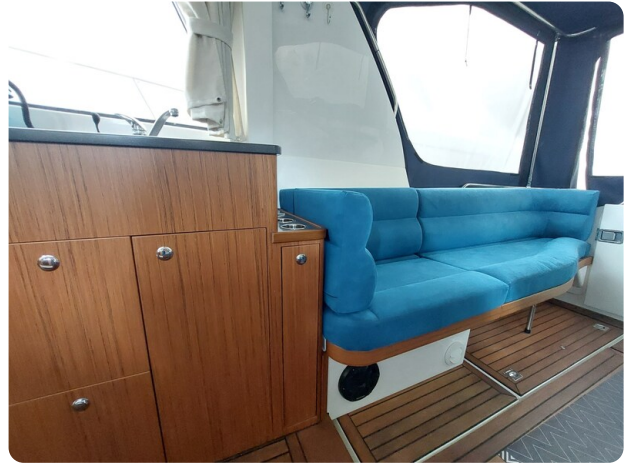
Saga 390 HT.jpg