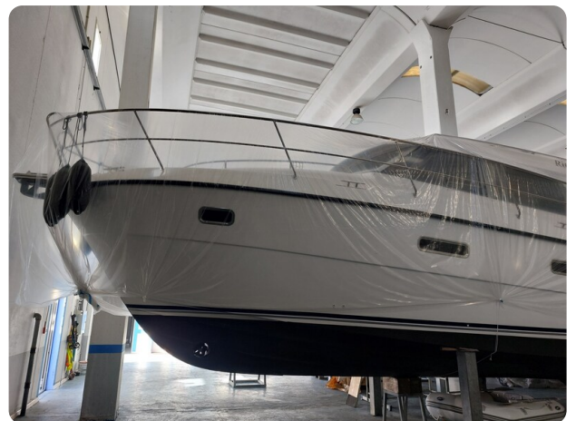
Saga 390 HT.jpg