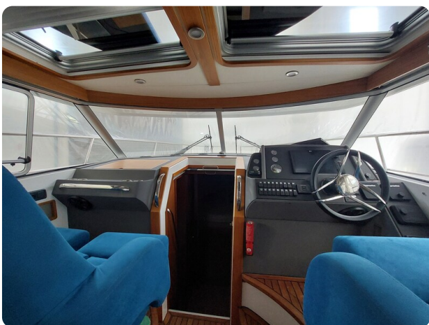
Saga 390 HT.jpg