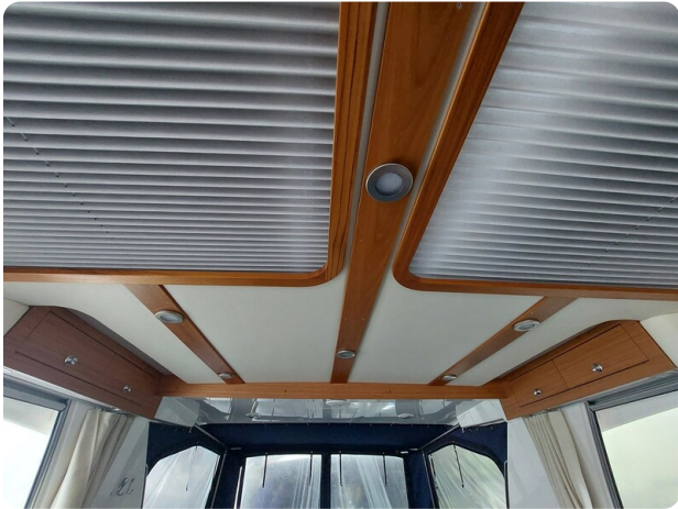
Saga 390 HT.jpg