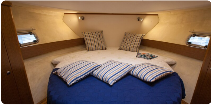
Saga 390 HT