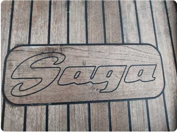
Saga 390 HT.jpg