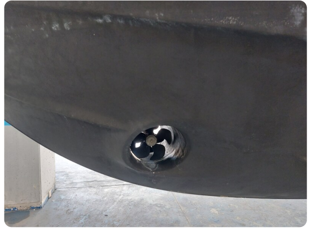
Saga 390 HT.jpg