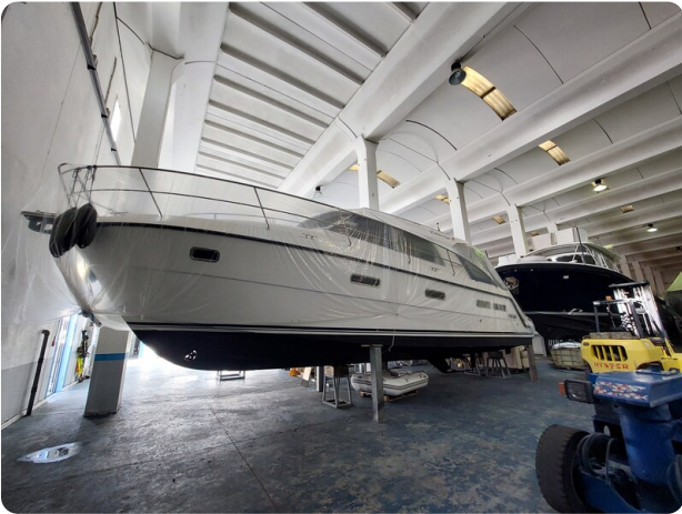
Saga 390 HT.jpg