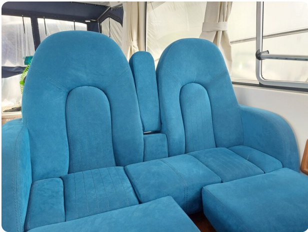
Saga 390 HT.jpg