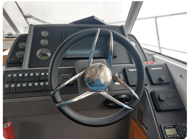
Saga 390 HT cockpit.jpg