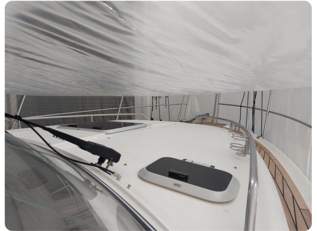
Saga 390 HT.jpg