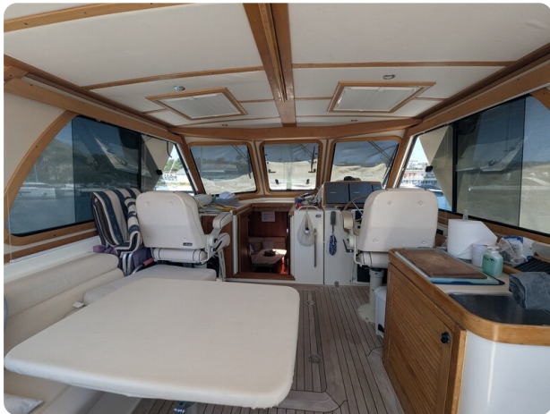
Sabre 42 Express upper cockpit view