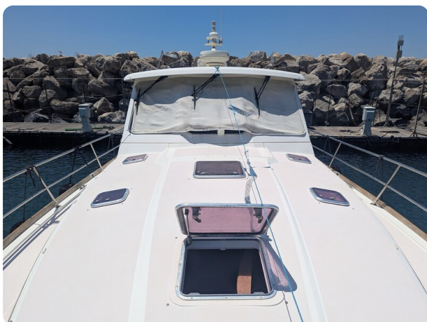
Sabre 42 Express fwd deck