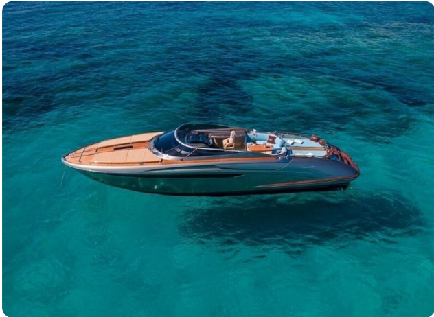
Rivarama Aerial 3