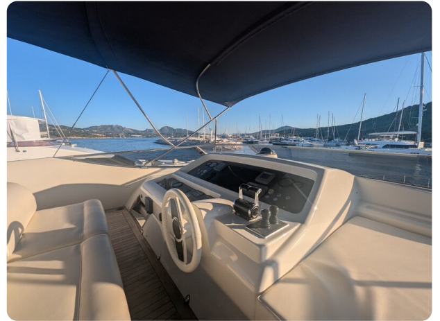
Riva 85 Opera helm detail