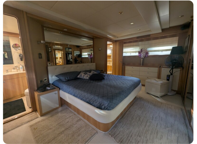
Riva Opera 85 owner's cabin