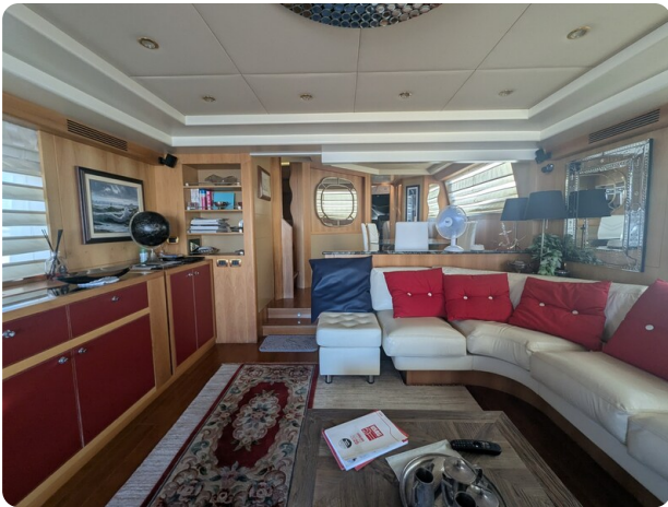
Riva 85 Opera salon