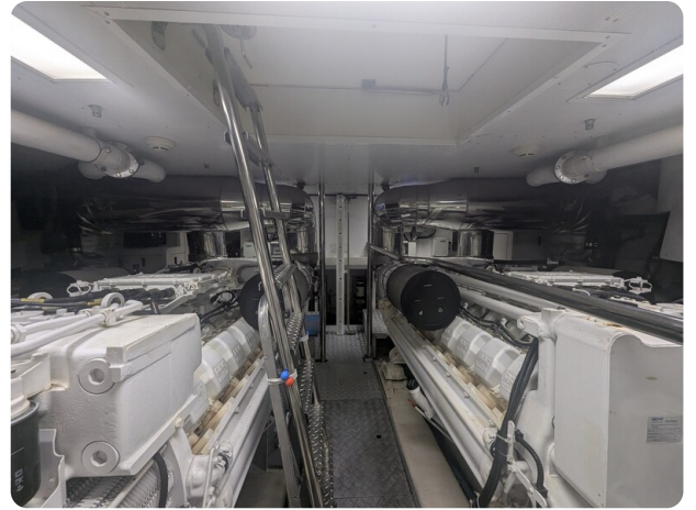
Riva 85 Opera engine room