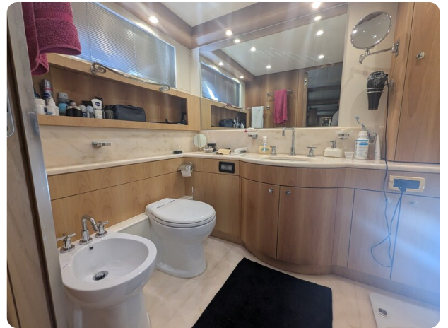
Riva 85 Opera owner's bathroom