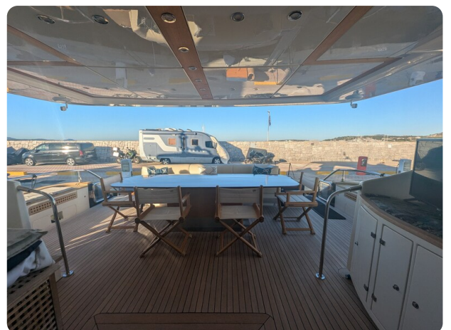
Riva 85 Opera cockpit view