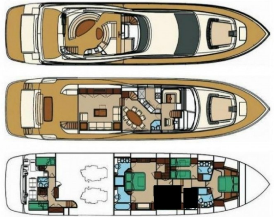
Riva 85 Opera 3 cabin layout