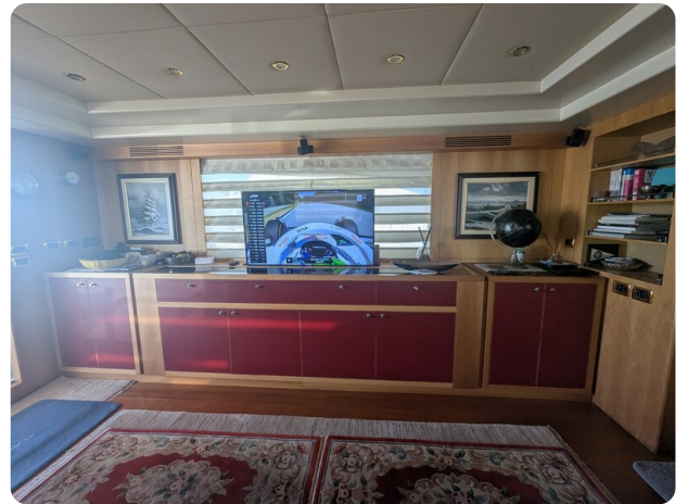
Riva 85 Opera, salon's Tv