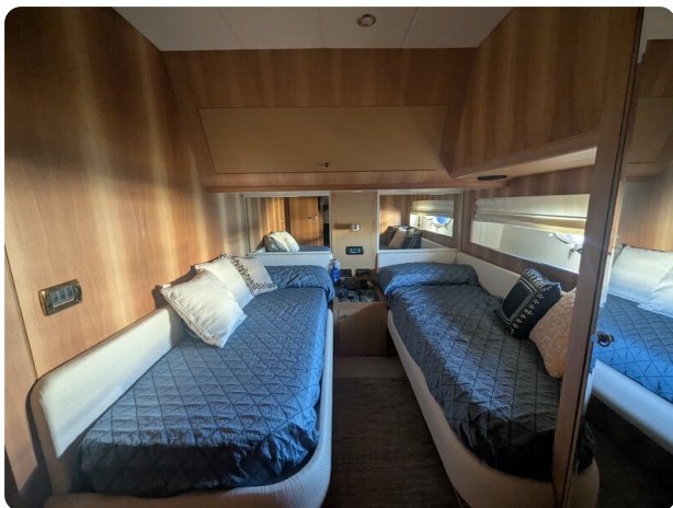
Riva 85 Opera guest cabin twin