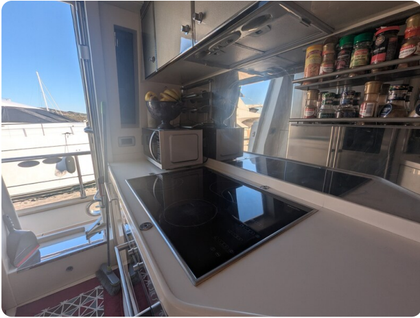
Riva 85 Opera galley detail