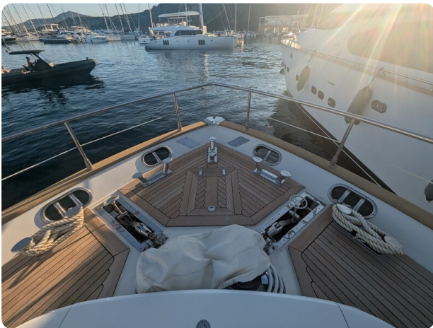
Riva Opera 85 bow deck