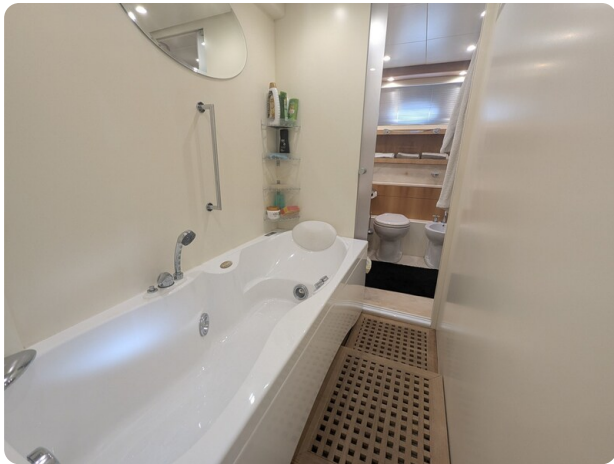
Riva Opera 85 bathtub