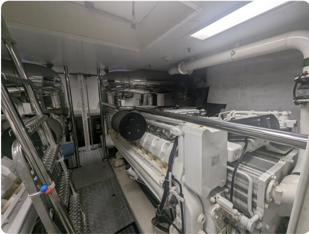
Riva 85 Opera engine detail