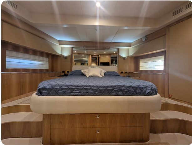
Riva 85 Opera Vip cabin