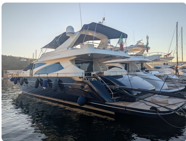
Riva 85 Opera aft profile 1