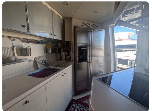
Riva Opera 85 galley