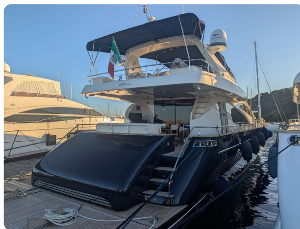
Riva 85 Opera stern view 1