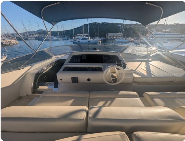
Riva 85 Opera Fly helm station