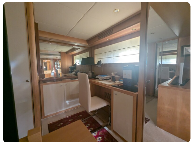
Riva Opera 85 owner's studio