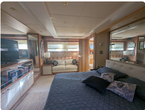
Riva Opera 85 owner's cabin detail