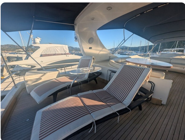
Riva Opera 85 Fly detail