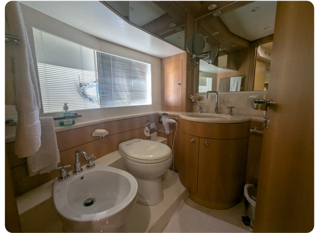
Riva Opera 85 Vip bathroom