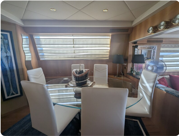
Riva Opera 85 dining area