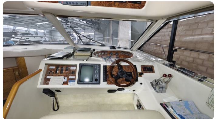
Princess 420 ARNO 8