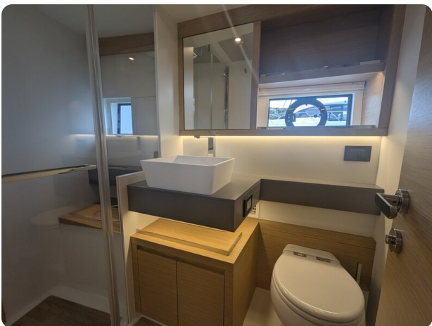
Pardo GT52 guest bathroom