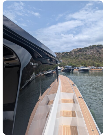
Pardo GT52 sideway