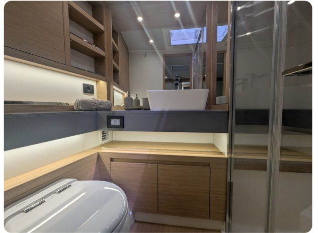
Pardo GT52 owner's bathroom