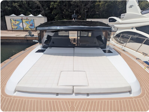
Pardo GT52 fwd deck with sunpad