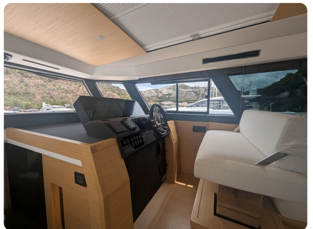
Pardo GT52 helm station