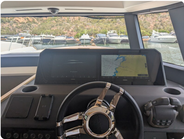
Pardo GT52 helm detail