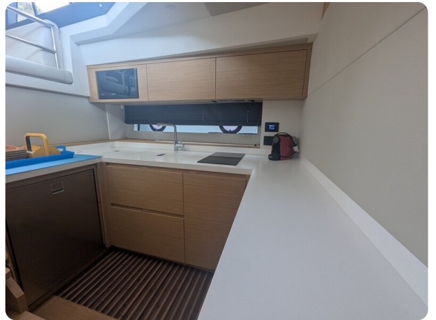
Pardo GT52 galley view