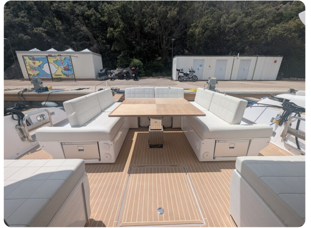
Pardo GT52 cockpit dinette convertible