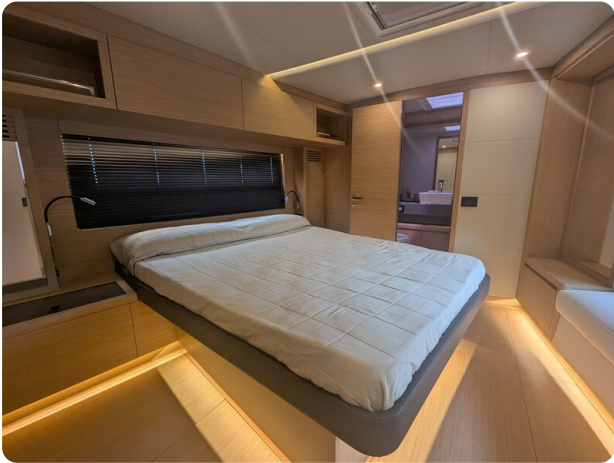
Pardo GT52 owner's cabin