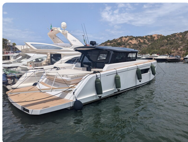
Pardo GT52 aft profile