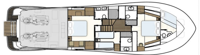
Lower deck 3 cabin