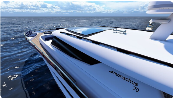
Copy of Top-side view