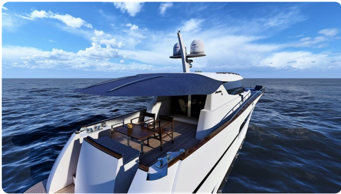
Copy of Stern