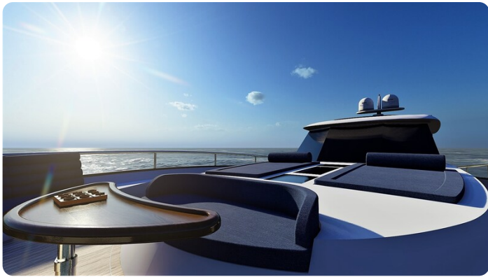
Copy of Bow