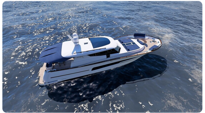
Copy of Top view