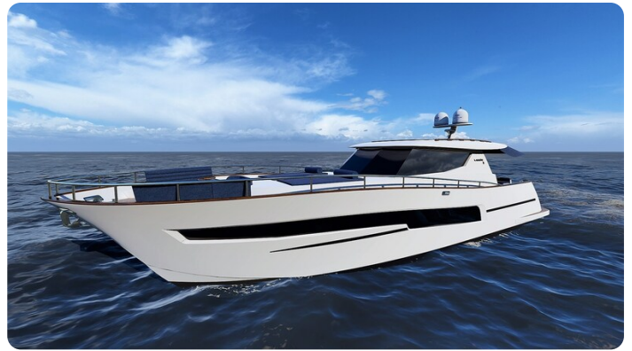
Copy of Front side