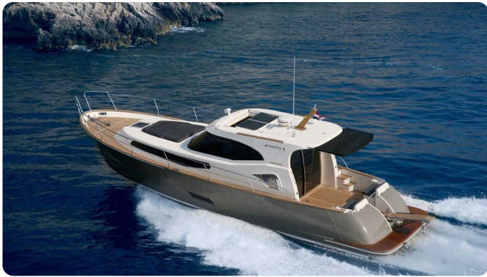
Monachus 45 SC 2