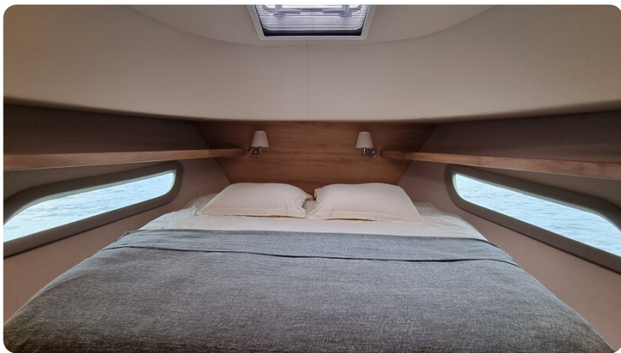
CMonachus 45 SC 6