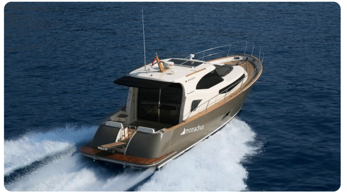
Monachus 45 SC 5