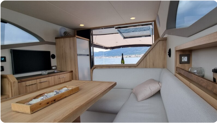
Monachus 45 SC 10