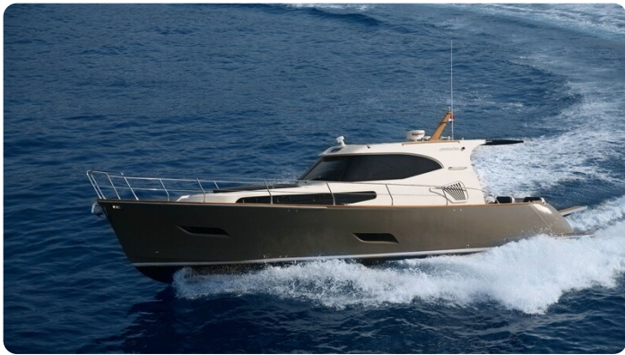
Monachus 45 SC 4