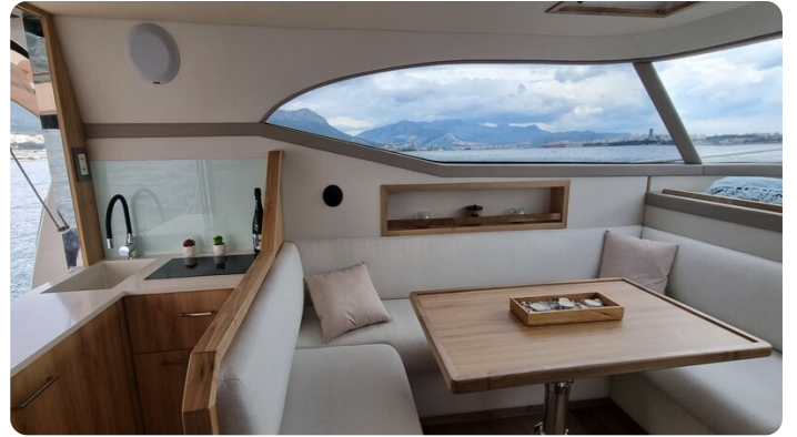
Monachus 45 SC 9