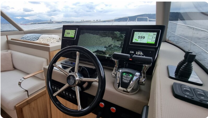
Monachus 45 SC 12