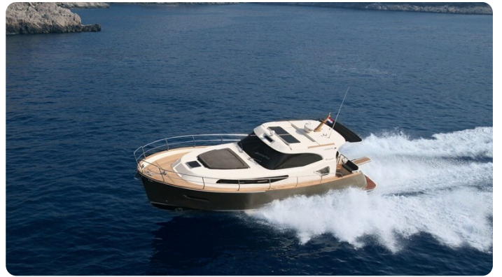
Monachus 45 SC 3