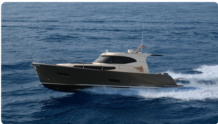
Monachus 45 SC 1