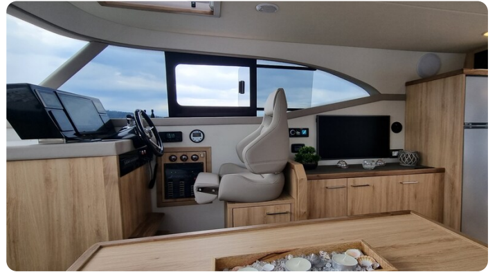
Monachus 45 SC 11