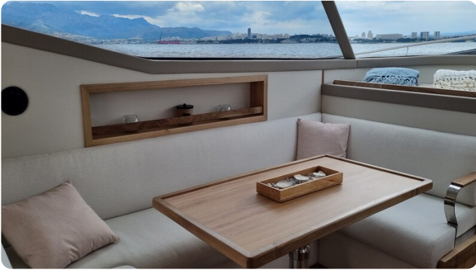
Monachus 45 SC 8