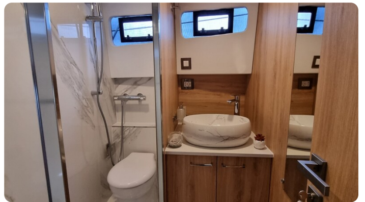
Monachus 45 SC 7