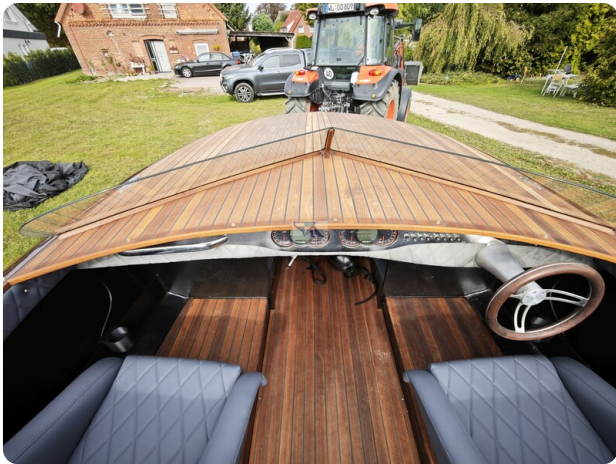
Kaiser 650 Super Sport 26