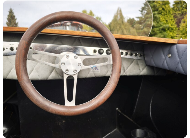
Kaiser 650 Super Sport 18