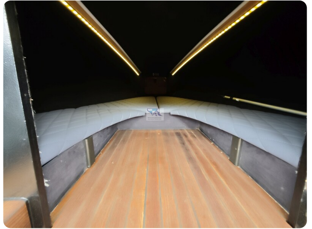
Kaiser 650 Super Sport 3