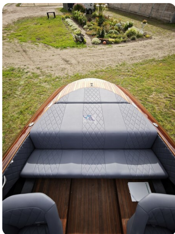
Kaiser 650 Super Sport 28