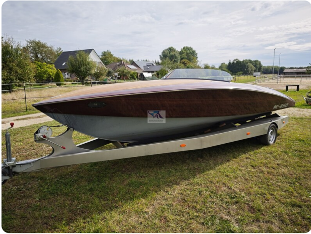
Kaiser 650 Super Sport 37