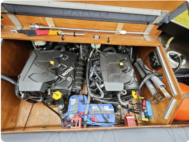
Kaiser 650 Super Sport 8