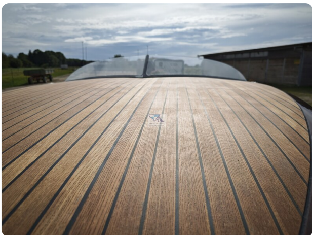
Kaiser 650 Super Sport 38