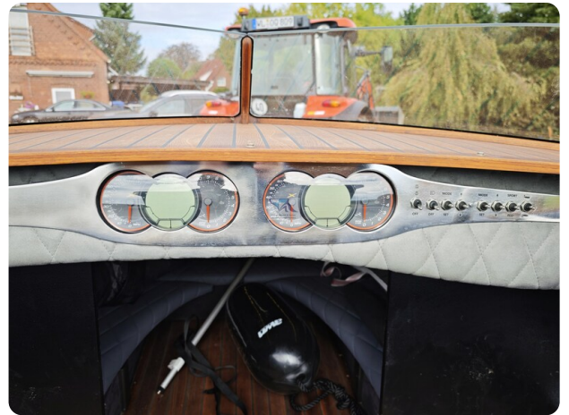
Kaiser 650 Super Sport 15