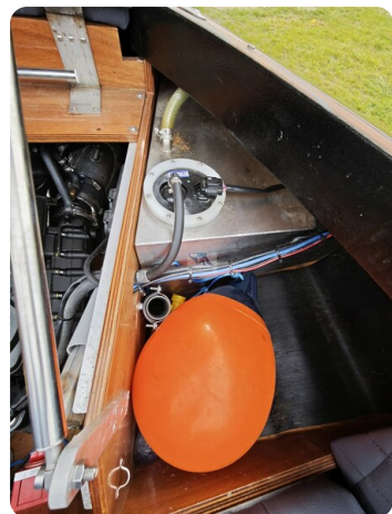
Kaiser 650 Super Sport 12