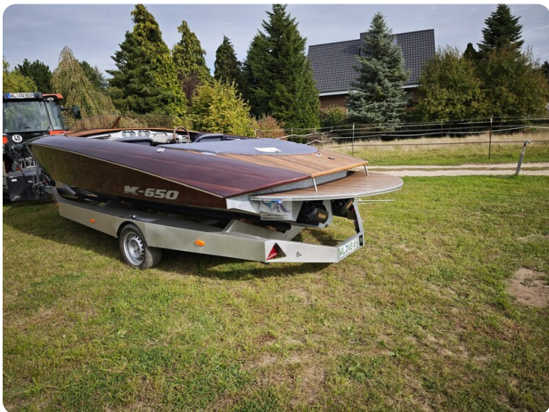
Kaiser 650 Super Sport 34