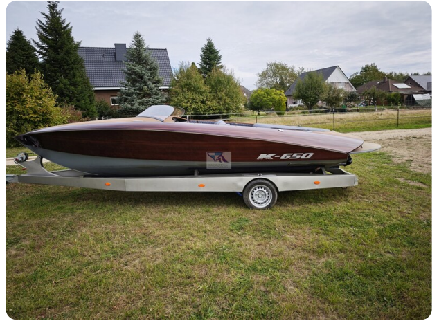
Kaiser 650 Super Sport 1