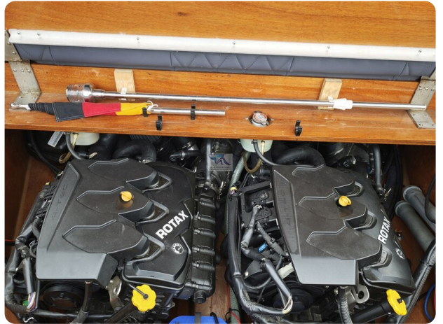
Kaiser 650 Super Sport 23