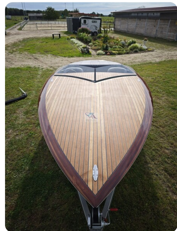
Kaiser 650 Super Sport 39