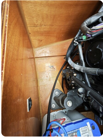
Kaiser 650 Super Sport 14