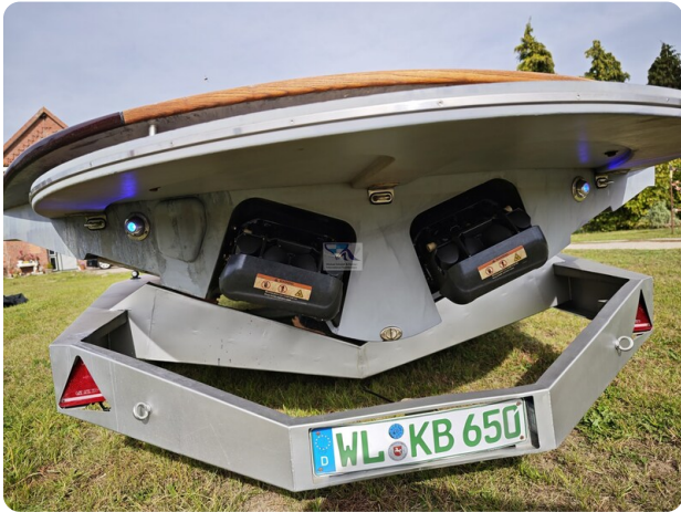
Kaiser 650 Super Sport 33