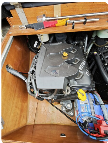
Kaiser 650 Super Sport 10