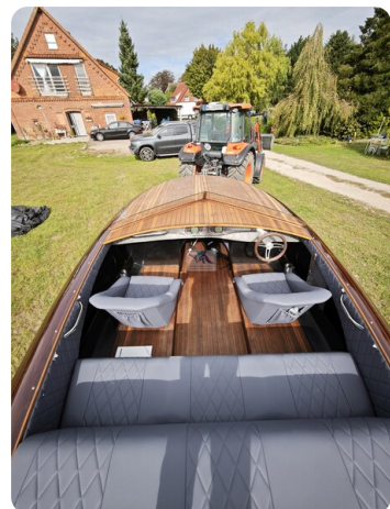
Kaiser 650 Super Sport 29