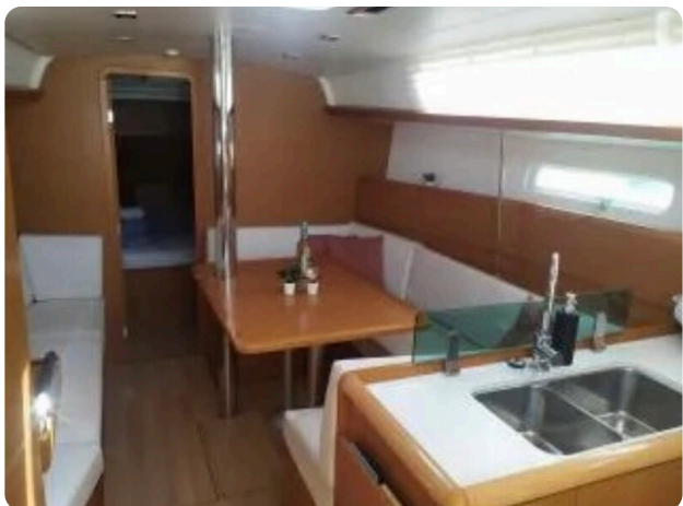
Jeanneau Sun Odyssey 389 ZIVJELLI 6