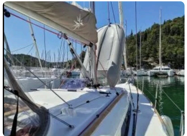
Jeanneau Sun Odyssey 389 ZIVJELLI 5