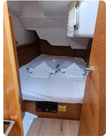
Jeanneau Sun Odyssey 389 ZIVJELLI 11