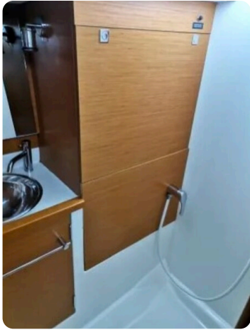
Jeanneau Sun Odyssey 389 ZIVJELLI 1