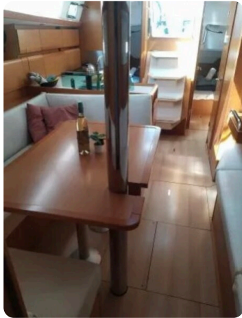
Jeanneau Sun Odyssey 389 ZIVJELLI 9