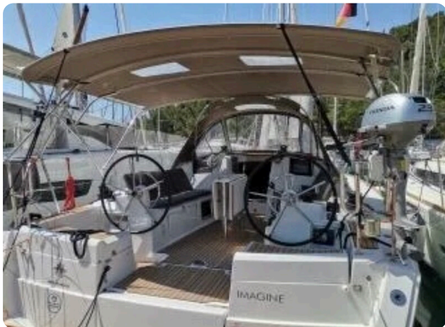
Jeanneau Sun Odyssey 389 ZIVJELLI 3