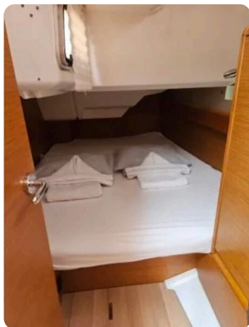
Jeanneau Sun Odyssey 389 ZIVJELLI 12