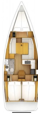
Jeanneau Sun Odyssey 389 ZIVJELLI 2