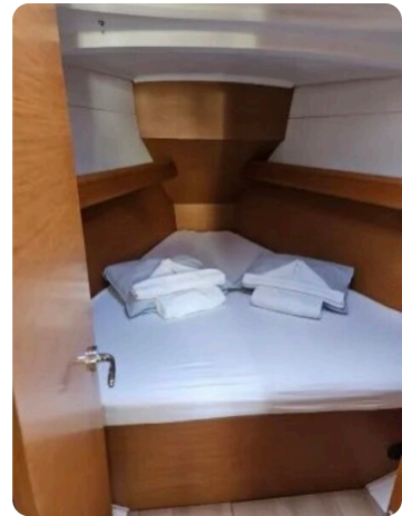
Jeanneau Sun Odyssey 389 ZIVJELLI 10