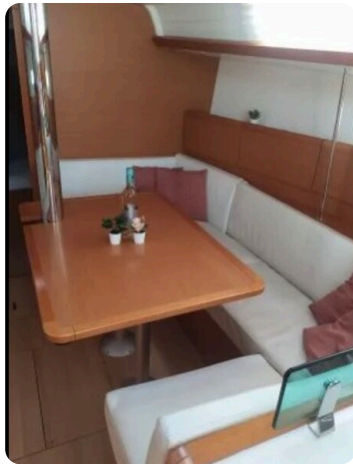
Jeanneau Sun Odyssey 389 ZIVJELLI 8