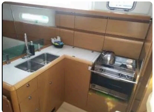
Jeanneau Sun Odyssey 389 ZIVJELLI 7