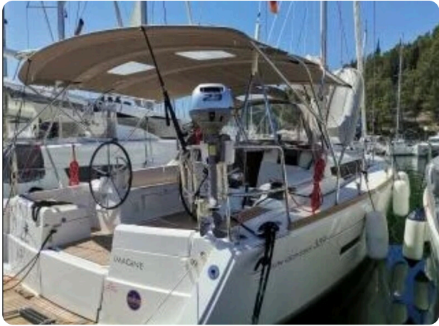
Jeanneau Sun Odyssey 389 ZIVJELLI 4