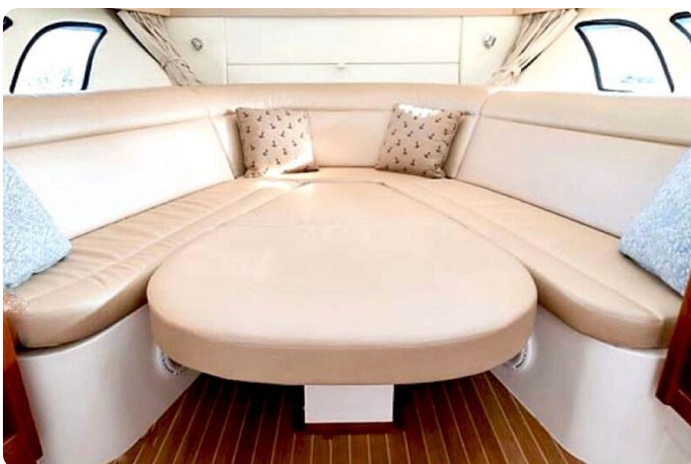
Intrepid 475 SY fwd conv dinette