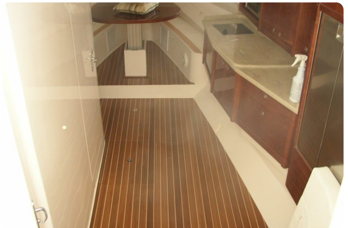
Intrepid 475 SY cabin