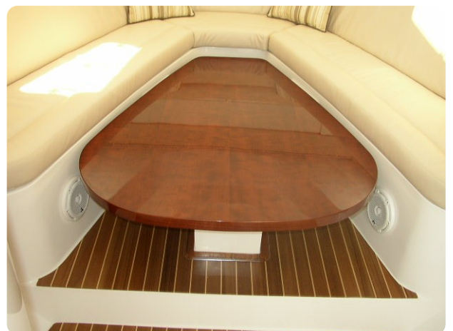
Intrepid 475 SY interior dinette