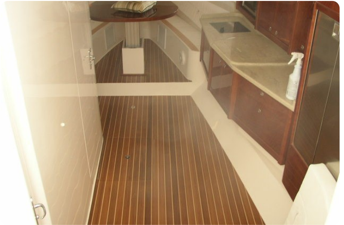
Intrepid 475 SY cabin