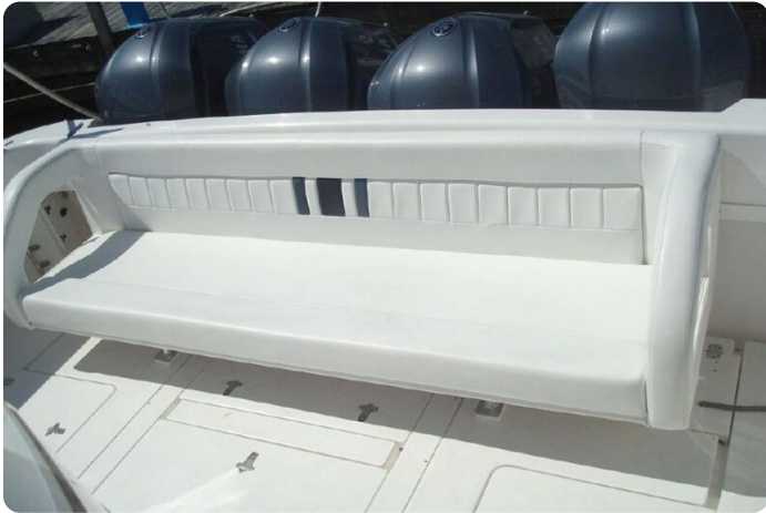
Intrepid 475 SY cockpit seating