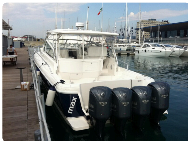
Intrepid 475 SY stern view