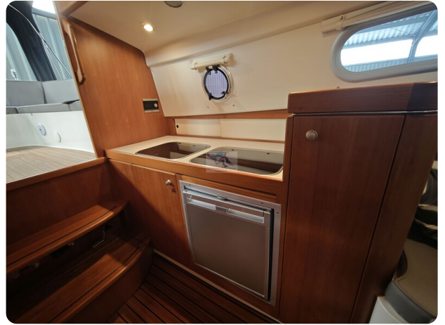
Inter cruiser 28 Cabrio ELVIRA 54