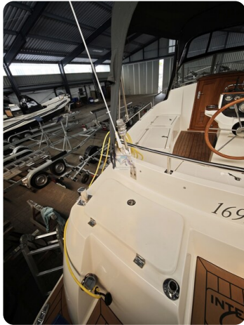
Inter cruiser 28 Cabrio ELVIRA 23