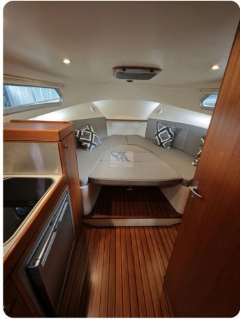
Inter cruiser 28 Cabrio ELVIRA 45