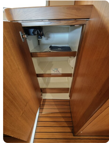
Inter cruiser 28 Cabrio ELVIRA 58