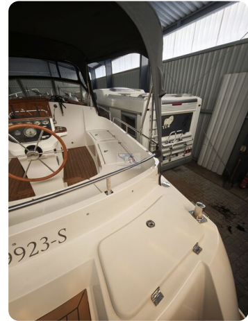
Inter cruiser 28 Cabrio ELVIRA 22