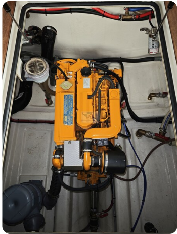
Intercruiser 28 Cabrio ELVIRA 40