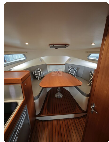
Inter cruiser 28 Cabrio ELVIRA 59