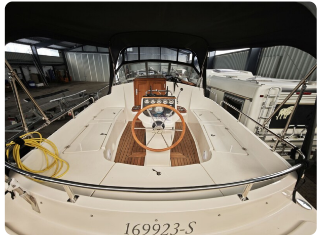
Inter cruiser 28 Cabrio ELVIRA 20