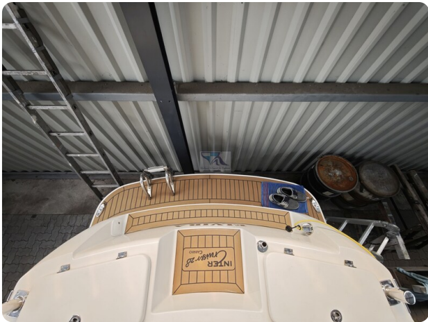
Inter cruiser 28 Cabrio ELVIRA 18