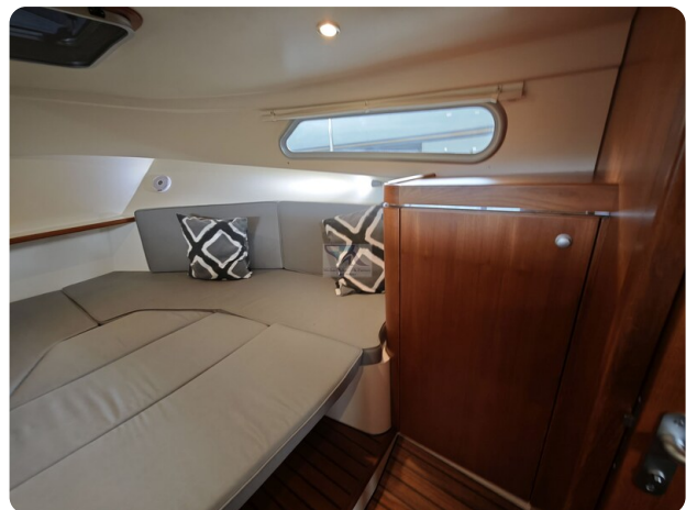
Inter cruiser 28 Cabrio ELVIRA 47