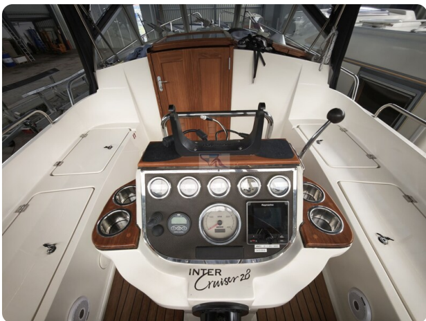
Inter cruiser 28 Cabrio ELVIRA 35