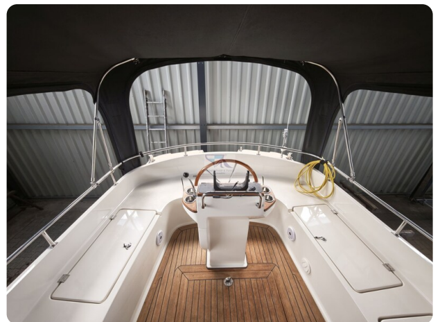
Inter cruiser 28 Cabrio ELVIRA 16