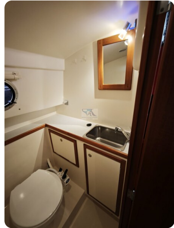
Intercruiser 28 Cabrio ELVIRA 50