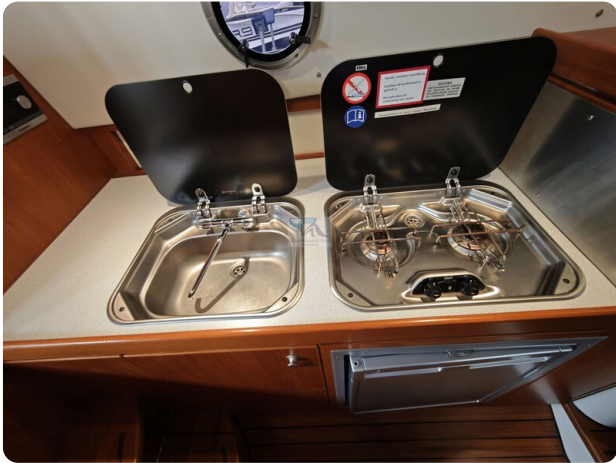
Inter cruiser 28 Cabrio ELVIRA 55