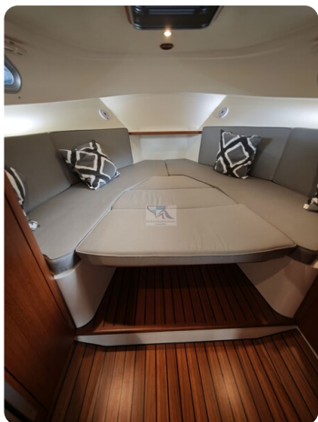
Inter cruiser 28 Cabrio ELVIRA 48