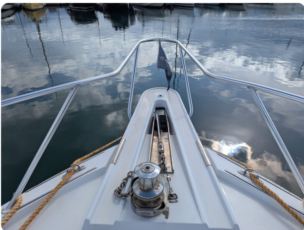
Hatteras 50 bow pulpit