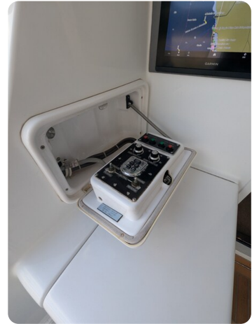
Hatteras 50 cockpit controls