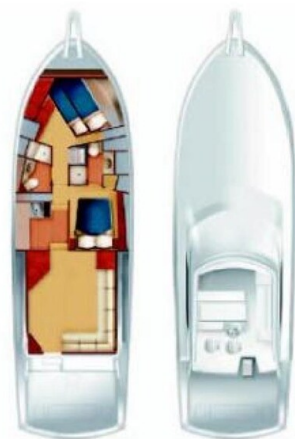
Hatteras 50 layout