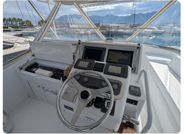
Hatteras 50 helm detail