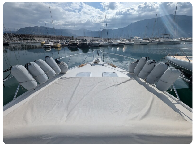
Hatteras 50 bow sunpad