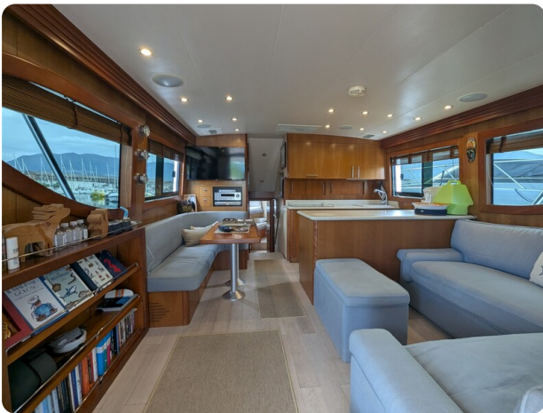
Hatteras 50 salon