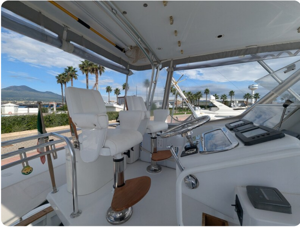
Hatteras 50 helm station