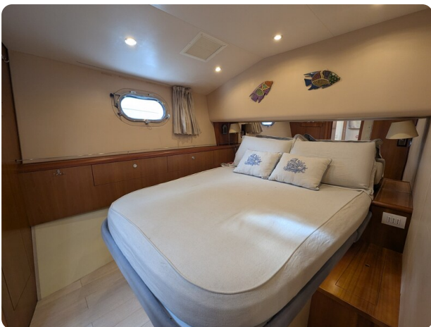
Hatteras 50 owner's cabin