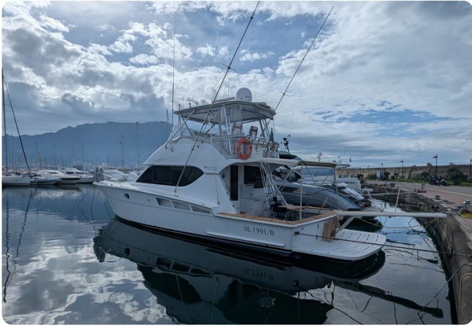
Hatteras 50 Conv. profile