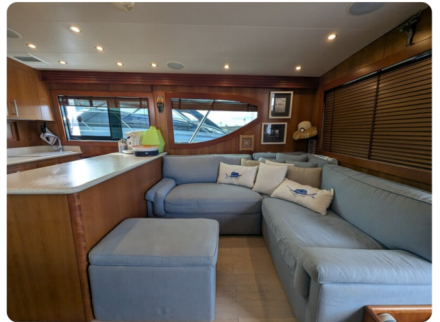
Hatteras 50 lounge