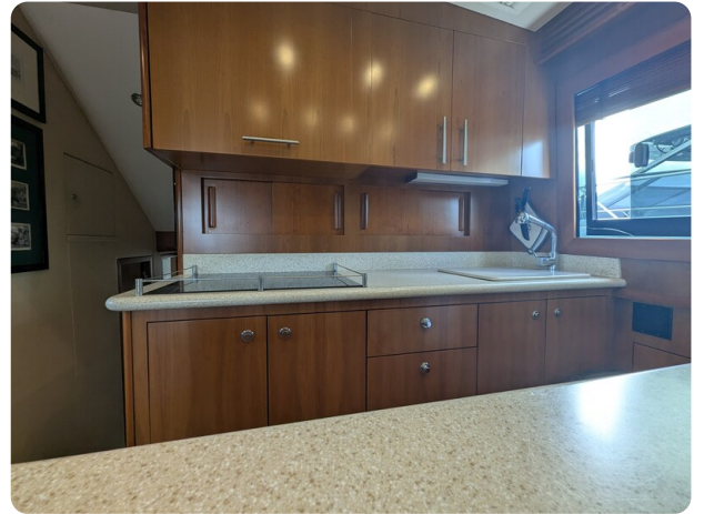
Hatteras 50 galley