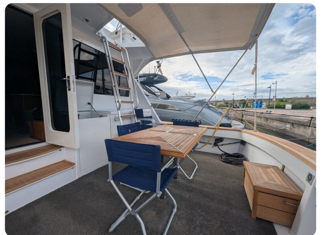
Hatteras 50 cockpit