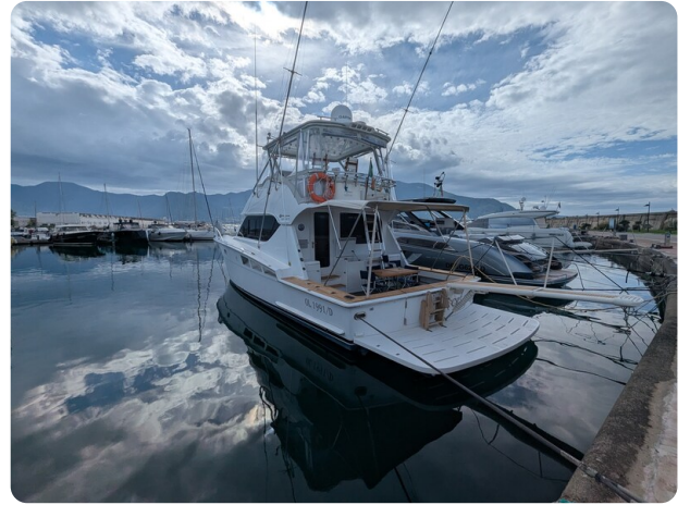
Hatteras 50 aft profile