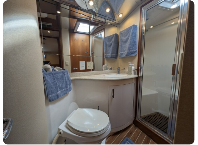
Hatteras 50 master head