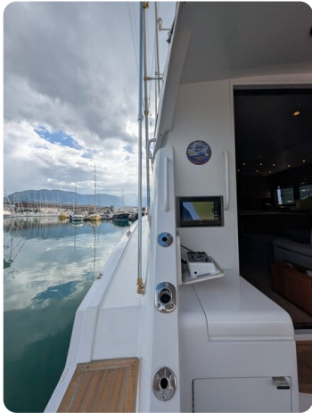
Hatteras 50 cockpit display