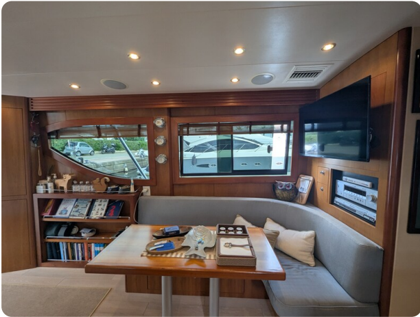
Hatteras 50 salon side