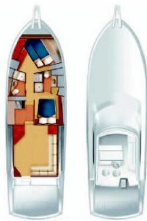
Hatteras 50 layout