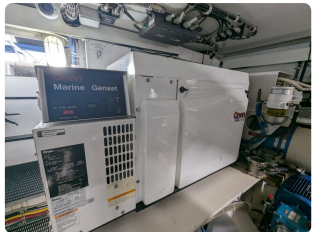
Hatteras 50 generator