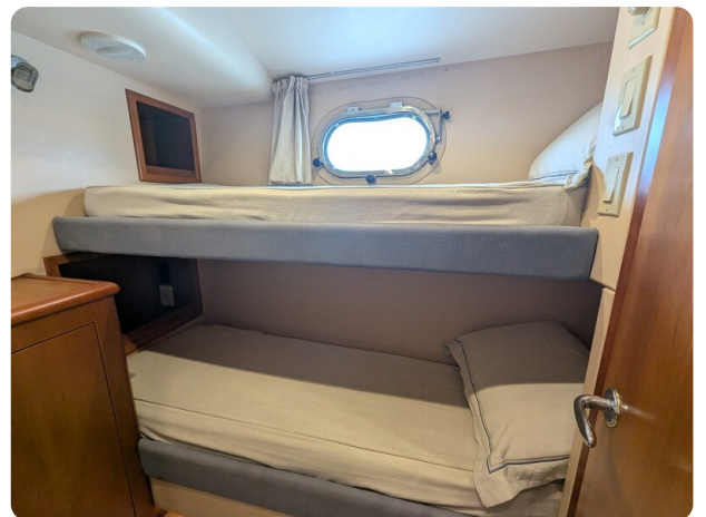
Hatteras 50 guest cabin