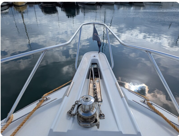
Hatteras 50 bow pulpit