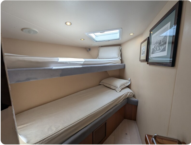
Hatteras 50 bow guest cabin