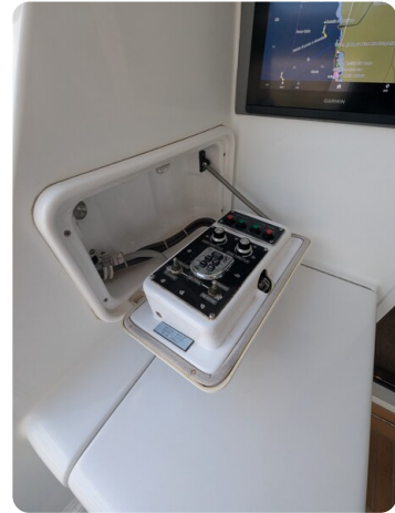
Hatteras 50 cockpit controls