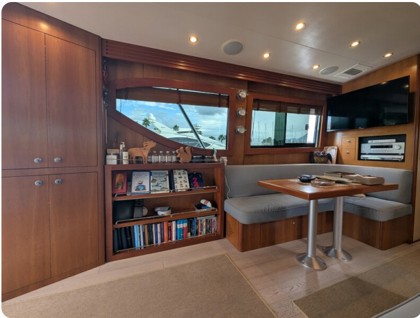
Hatteras 50 dinette