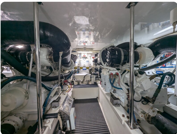
Hatteras 50 engine room