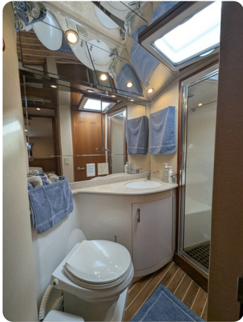
Hatteras 50 head and shower