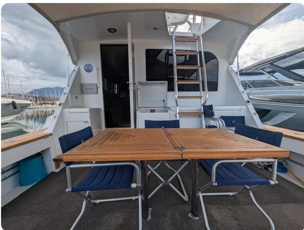
Hatteras 50 cockpit view