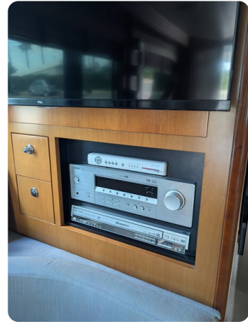
Hatteras 50 v and stereo system