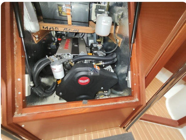
Hanse 418 EDGE 63