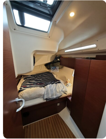
Hanse 418 EDGE 61