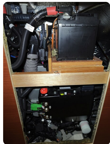
Hanse 418 EDGE 45