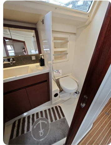
Hanse 418 EDGE 55