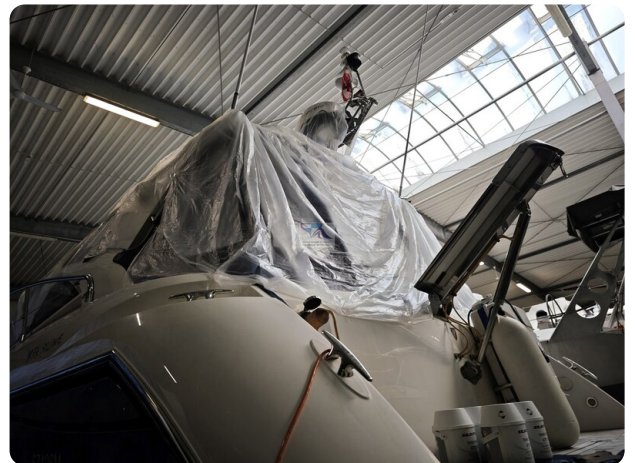
Fairline Targa 38 54