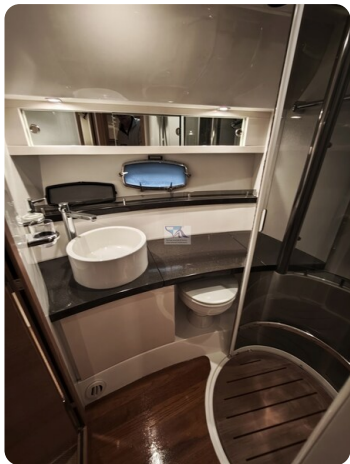
Fairline Targa 38 48