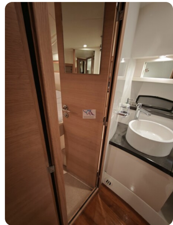
Fairline Targa 38 49