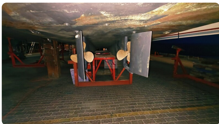
Reinke Tourina 10m_97