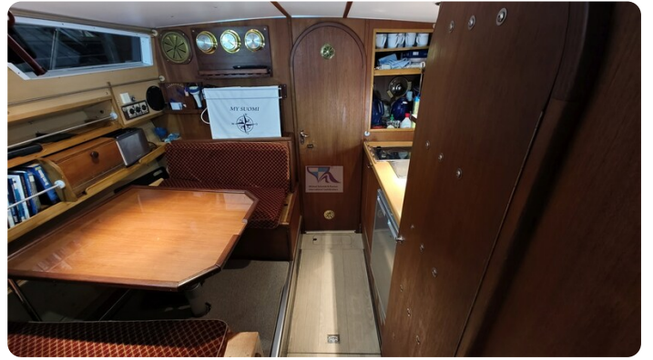
Reinke Tourina 10m_34