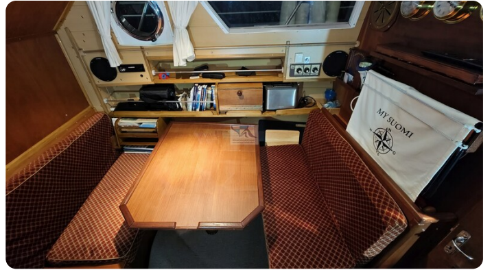
Reinke Tourina 10m_12