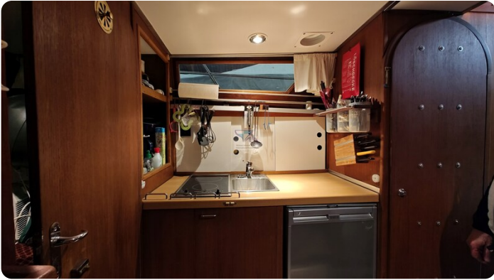
Reinke Tourina 10m_8