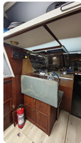
Reinke Tourina 10m_37