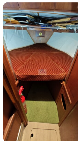
Reinke Tourina 10m_5