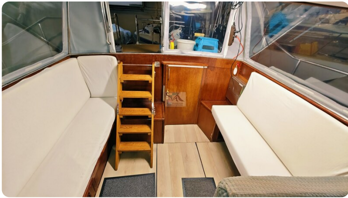
Reinke Tourina 10m_68