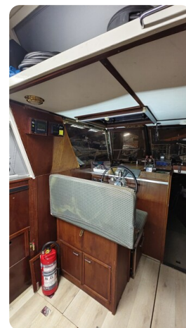
Reinke Tourina 10m_37