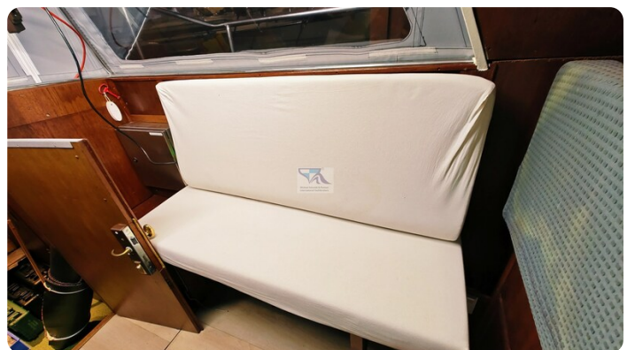
Reinke Tourina 10m_64