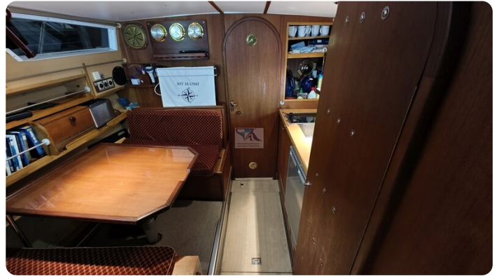
Reinke Tourina 10m_34