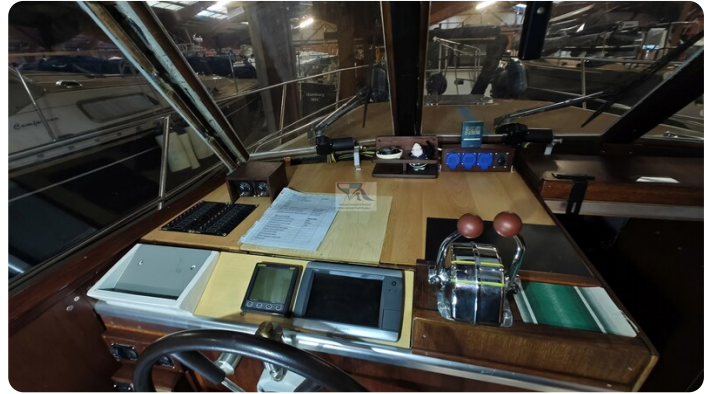
Reinke Tourina 10m_41