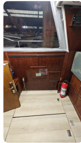
Reinke Tourina 10m_47