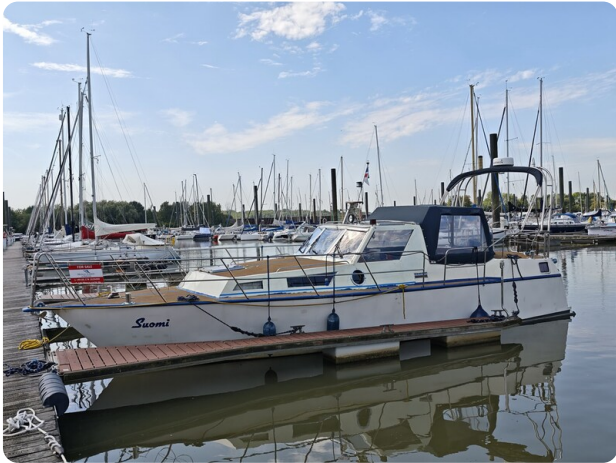
Reinke Tourina 10m SUOMI 2