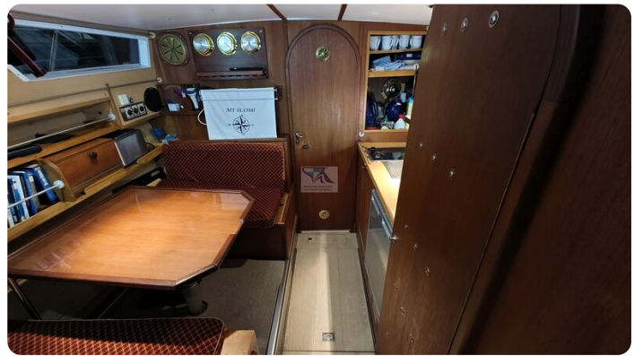
Reinke Tourina 10m_34