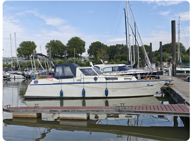
Reinke Tourina 10m SUOMI 3