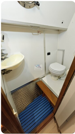
Reinke Tourina 10m_28