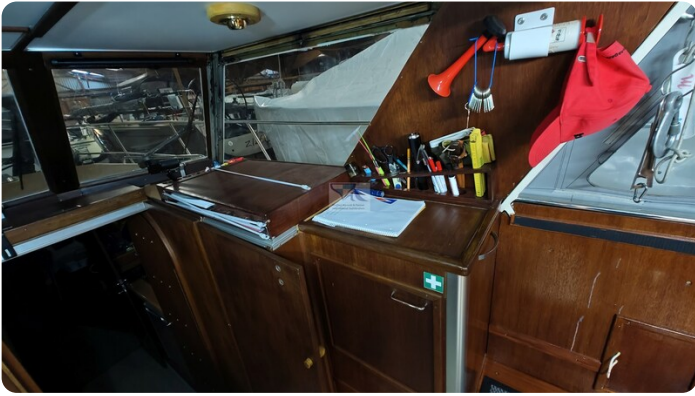
Reinke Tourina 10m_46