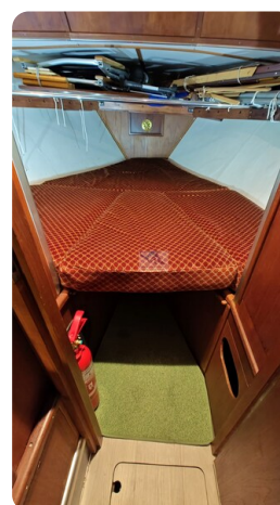
Reinke Tourina 10m_5