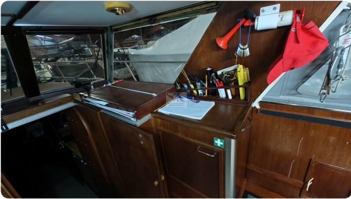
Reinke Tourina 10m_46