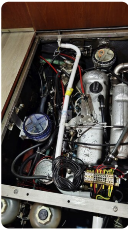
Reinke Tourina 10m_51