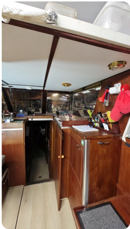
Reinke Tourina 10m_38