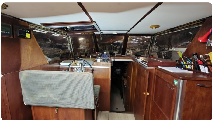
Reinke Tourina 10m_35