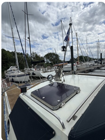
Reinke Tourina 10m SUOMI 16