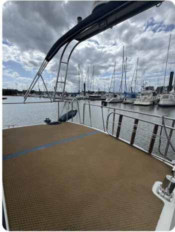
Reinke Tourina 10m SUOMI 9