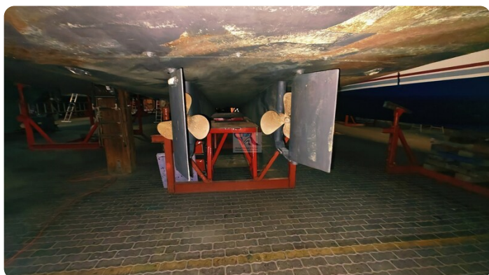
Reinke Tourina 10m_97