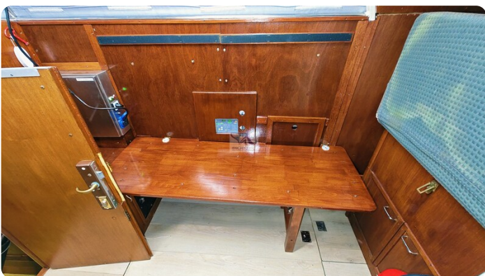
Reinke Tourina 10m_62