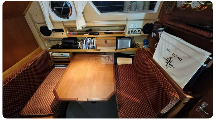
Reinke Tourina 10m_12