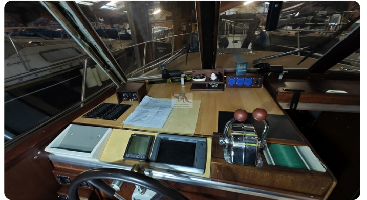
Reinke Tourina 10m_41