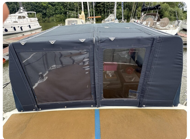
Reinke Tourina 10m SUOMI 15