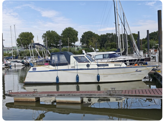
Reinke Tourina 10m SUOMI 1