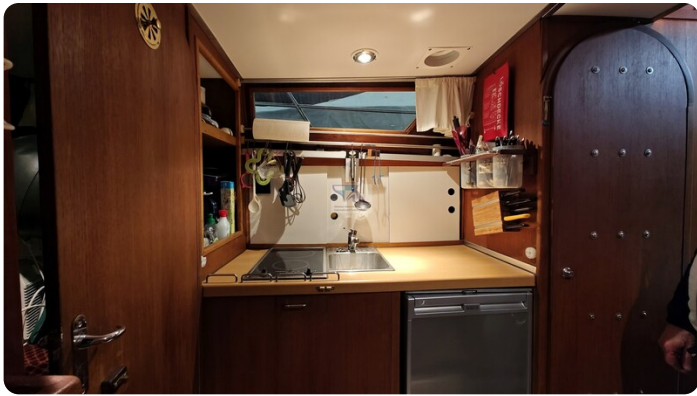
Reinke Tourina 10m_8