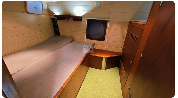
Reinke Tourina 10m_75