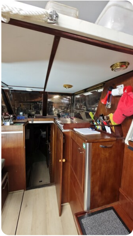
Reinke Tourina 10m_38